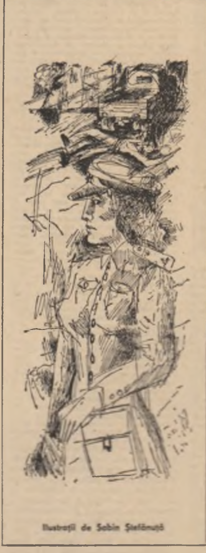
Ilustrații de Sobin Ștefan

— S-a speriat, recunosc... s-a speriat. M-a prins de gât, adică și-a așezat minile pe după umerii mei, ba, chiar m-a mîngiat pe ceafă. La drept vorbind, mie mi-a plăcut, totuși... Ea a strigat: — Ești nebun, nene locotenent? — Când am întors capul, în prag se afla tovară- sa locotenent Elena, care ne analiza critic. Asta e! Adică, mi se pare că m-a sărutat și mi-a spus că ar fi bine să nu-mi mai dau cu lavandă triplă după ras... a vorba de tovarășe Magdalena... — În biroul șefului s-a lăsat o linie de cerou. Ofițerul de serviciu a uitat, din nou, să res- pire, locotenentul Elena a rămas cu privirile pierdute în desenul covorului coplesit de mi- lunosele ei îngrățate de mator al scenei... Tovară- șul colonel, cu palmele pe temple, a mai exclamat, nu știu pentru a căta oară: — Incredibil! — Acesta-i adevărul, fie ce-o fi. — Ii dai șama ce-ai făcut? De cite ori să vă explic! Măi naibii... Ah!... — Disperarea cădea peste capul șefului. — Te așteaptă judecata creștă a colectivui- lui! — M-a încurajat. Ai vreo idee? Cred că