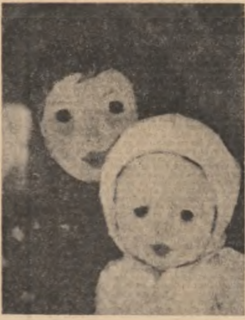
Tonitza: • „Doi copii” • „Peisaj marin la Mangalia” • „Tucileană”

Par a trumpe din istorie prin acest zăgăzav tot noptii pământului ră-