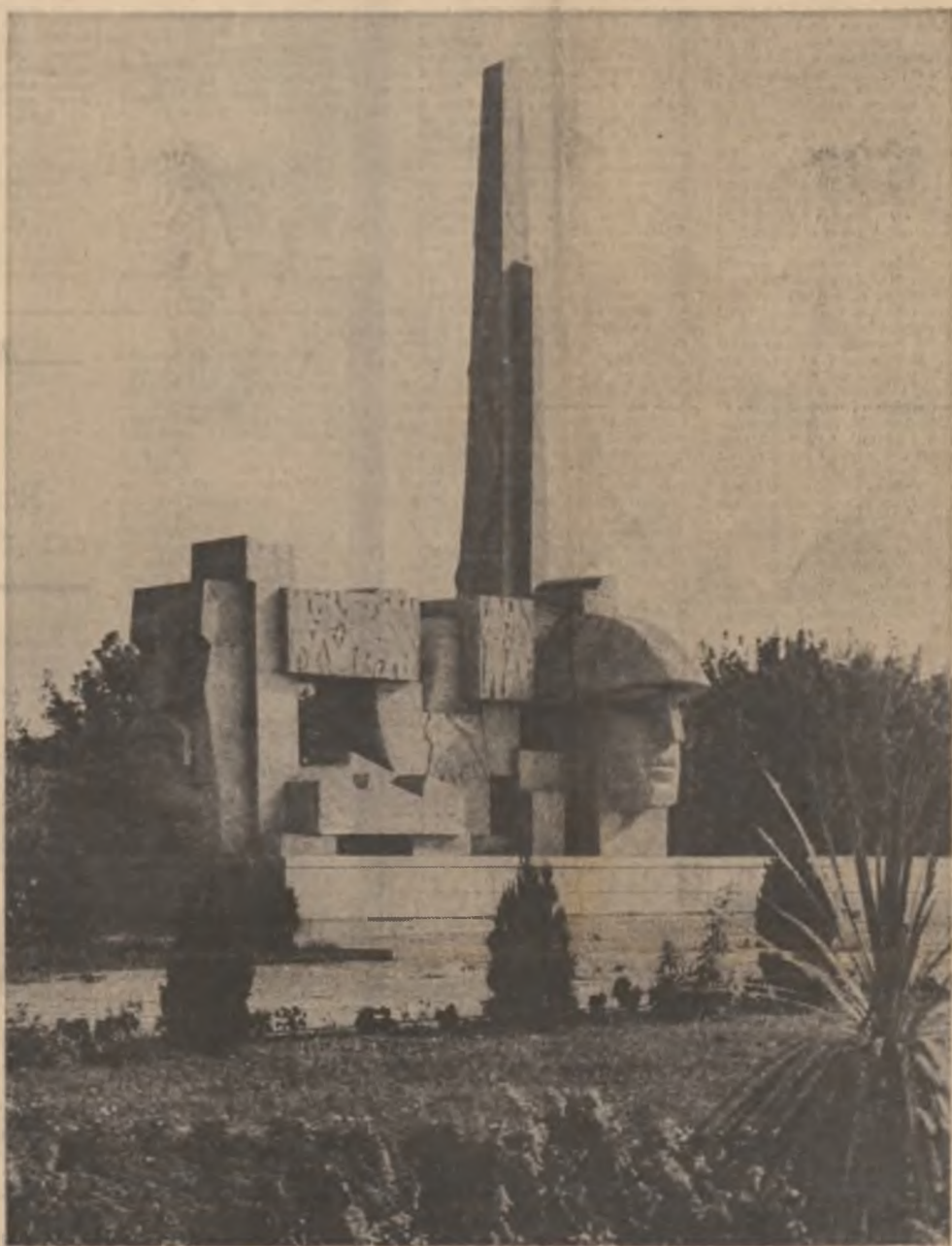
MONUMENTUL OSTAȘULUI ROMÂN DE LA CAREI • SCULPTURA: VIDA GEZA • ARHITECTURA: PETRE DIMBOIANU