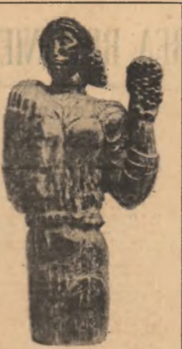
Mircea Ștefănescu: „Tantomă” (Din expoziția deschisă la sala Dalles)