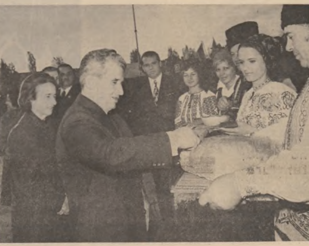
Un grup de oameni discutând la o masă.