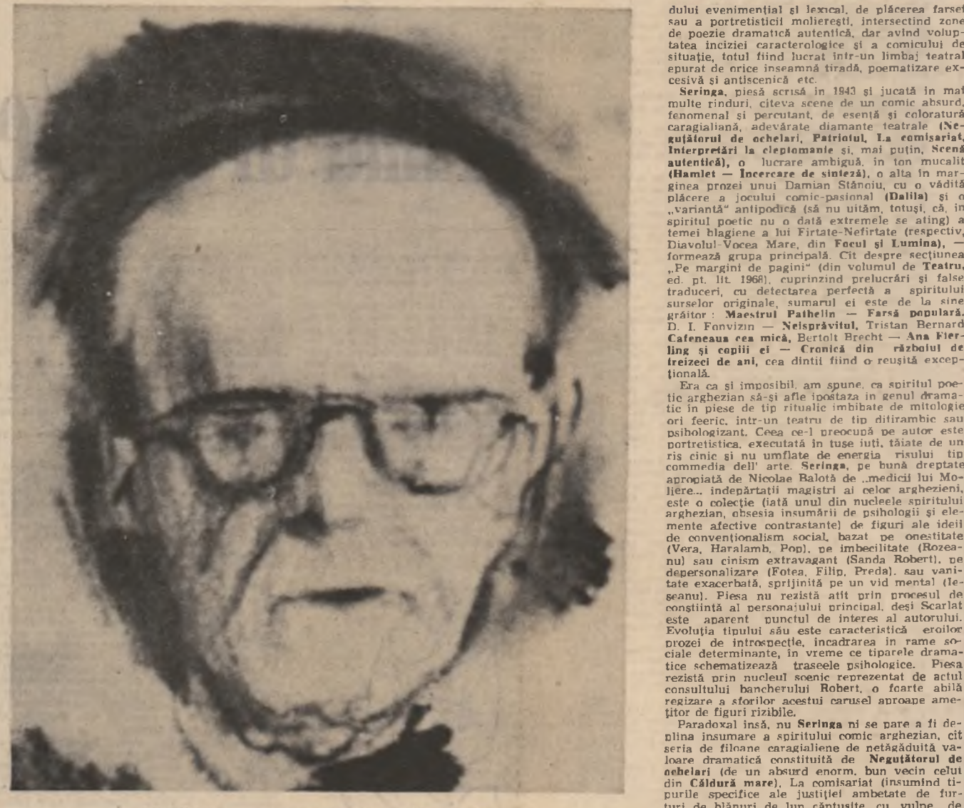
ARGHEZI - desen de Corneliu Baba