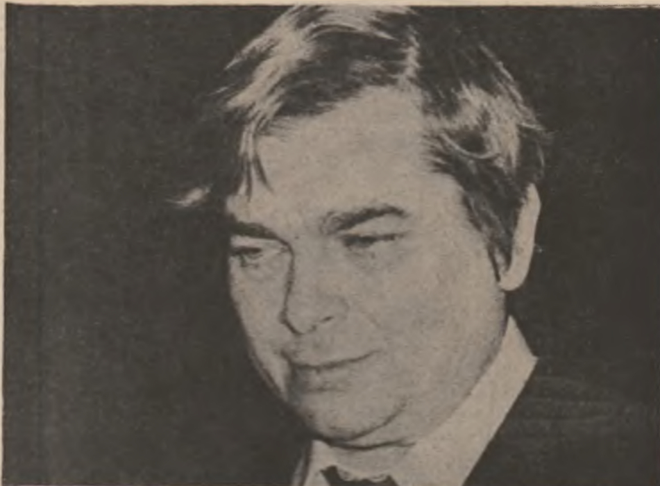
Fotografie de Ion Căru

Leopardul mă apăsa cu laba pe timp - Te fac ondulat și roșu, ca pe un olan pentru că totuși, se mai întimplă să plouă-n Sahara, în cite-un an. Leopardul mă apăsa cu tandrețe - Aș vrea să-mi fac o ramură din tine, un acoperiș sub care întins, cu tristețe pe leoparda mea s-o mușc în pieziș. - Omoară-mă odată și nu mă mai chinui atîta, atîta, am strigat de sub iuțita de blană a sa. Eu nu-ți voi fi ție urita, omenească de carne, a ta. - Șezi blind, mi-a spus leopardul șezi blind, el mi-a spus, eu nu-ți sunt cruce și nici tu nu ești bardul, eu nu-ți sunt credință, și nici tu Isus. Te subțiez, atîta fac cu tine.