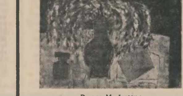
Dragoș Morărescu: „Compoziție în facon roșu”

Biruință pecetluită De visul singelui pe gură Dorința, nu ne mai apare Ca o alegere de mirată natură A sufletului noastre O liniște cernută de întreaga-ne făptură Pe floare de doi Tăcem acum prietene