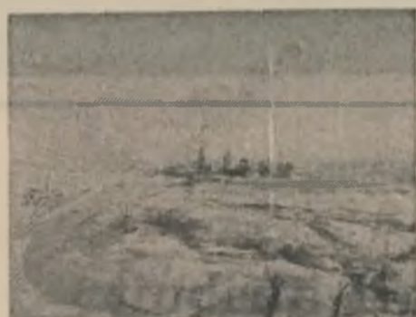
Gheorghe Mocanu: „Petrochimie”