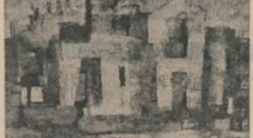
Dragoș Morărescu: „Arhitectură antică”