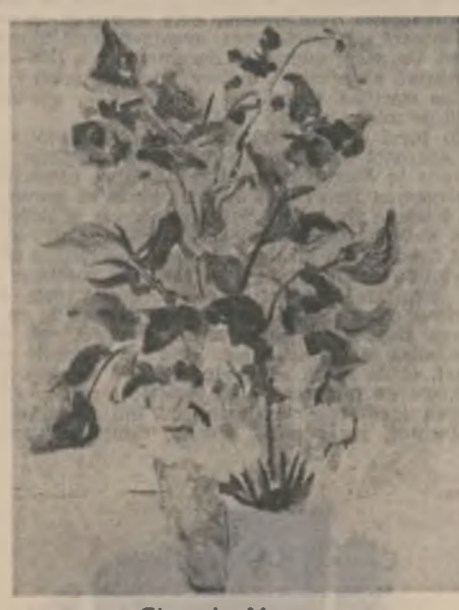
Gheorghe Mocanu: „Natură statică cu flori”