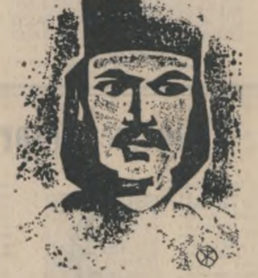
Desen de Șerban Rusu Arbore