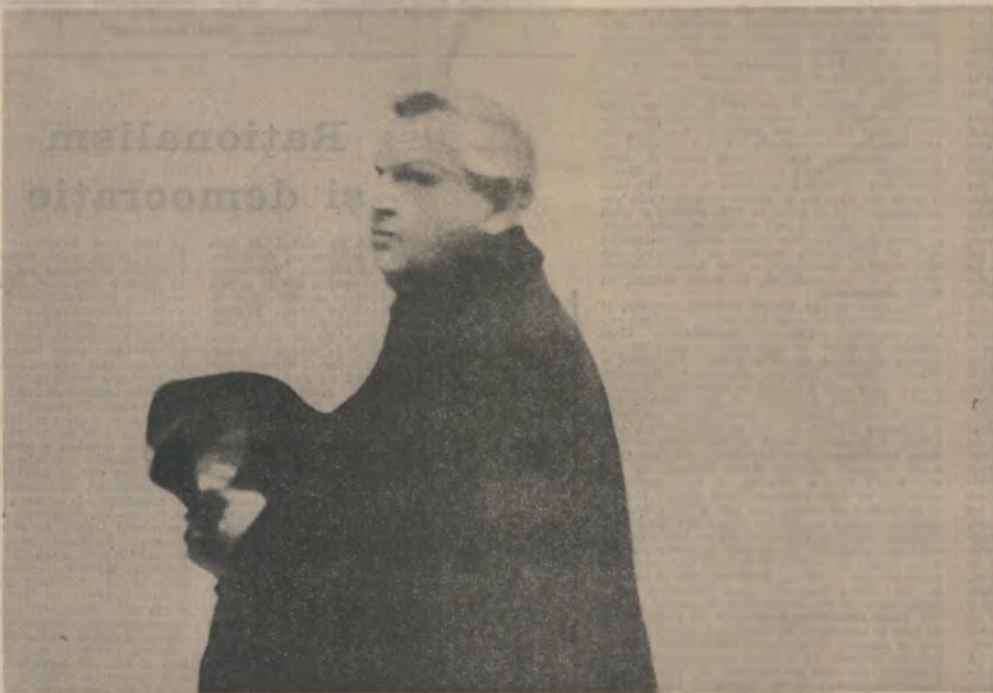
INEDIT. M. Sadoveanu în togă de academician cu prilejul discursului de recepție (1923).