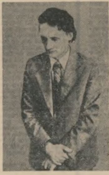
Că nu te cațări sus la floare, Ci zbori, de ea chemată blind.

dar tot mai pustie mi-e gura de cîntec de cîntecul tău. Imi curge, mamă, insingurarea pe trup ca apa pe stînci,