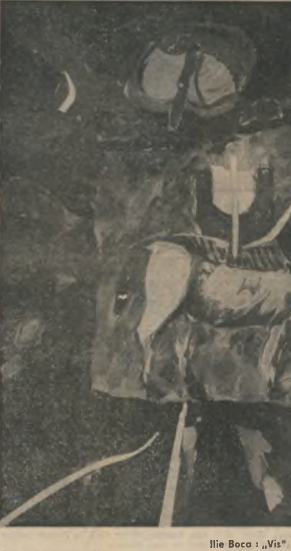
Ilie Boca : „Vis”