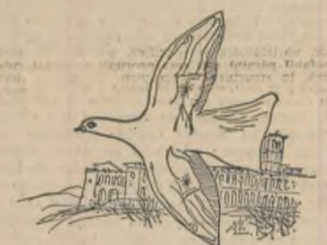
Desene de Mihai Vulcănescu

a mea, a mea, a mea, a mea cînd pe stejar doar primăvara îl trecea.