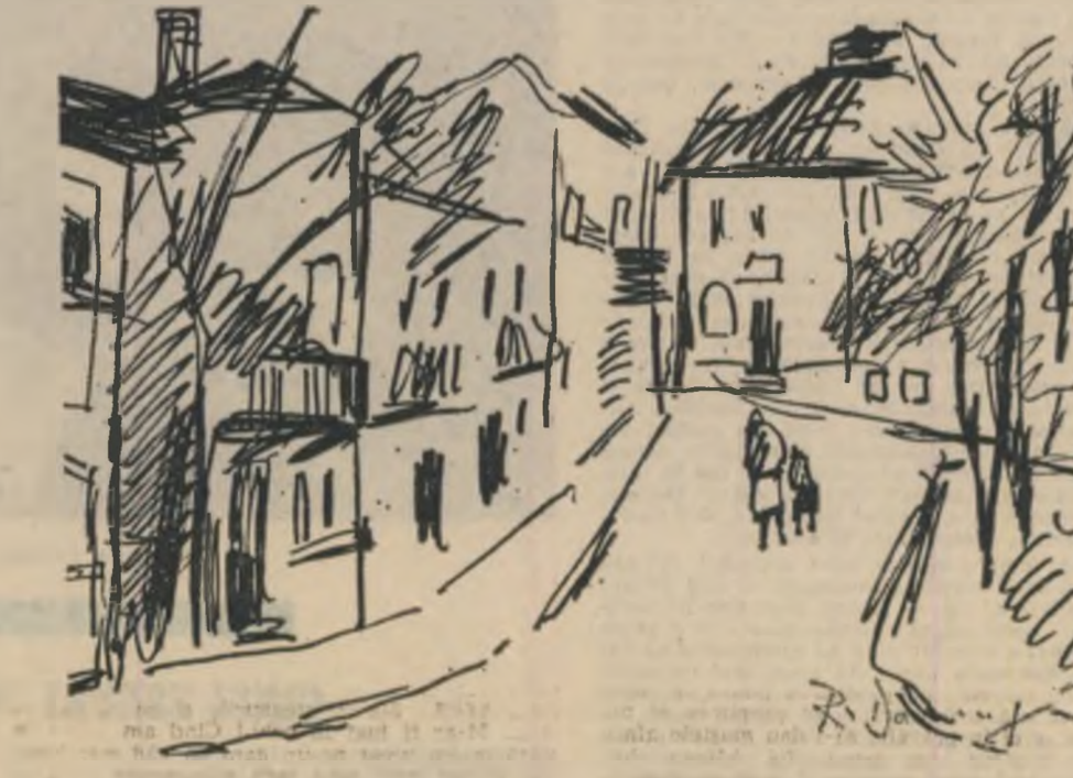
Desene de Radu Dărăngă (paginile 3, 4, 5, 6 și 7)

la raft. Știi, politicoș, prezentabil... Ce mai? După alt an eram ca un domn; cravată de mă- tase la mine, cămașă de mătase, chiar și chilo- ții de mătase! Patru costume — fiecare cu cite două cămăși și pantofi asortați. Veneau fetele după mine ca la miere. Băgau capul pe usa pră- văliei, întrebau de Titi adică de mine, și dacă nu eram acolo se intristau... Imi spunea patronul după aceea. Erau chiar două foarte drăgălate l... Alea două la care și-am spus că le scriam după front... Știau una de alta, dar nu-mi reproșau. Una din ele-mi zicea: Titi scump, nu mă intere- sează l! Dacă ești cu mine azi, sint fericită o săptămînă l... Zicea și-i sticleau ochii ca la fiare, domnule! Era brunetă. Își umplu paharul și îl privi admirativ.