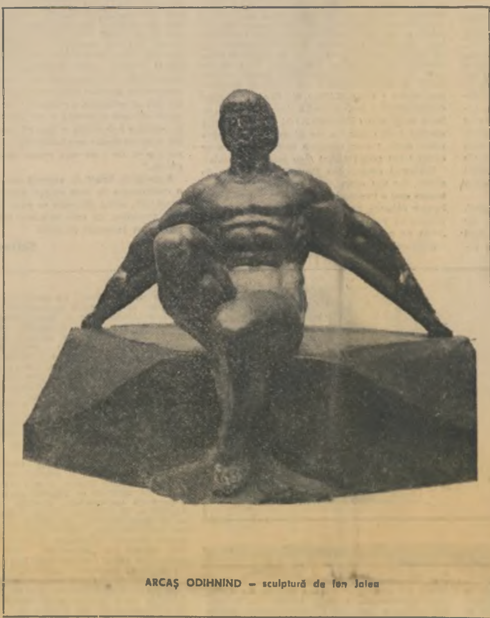
ARCAȘ ODIHNIND — sculptură de Ion Joles

Ființele luminii b ucuria pe care mi-a adus-o această primăvară cu greu va mai putea fi egalată de alta. Pentru că, oricît de efemeră ar fi, bucuria mea s-a născut aproape din nimic, de aceea cred că va dura și că nu o vom uimbrî nicî o întimplare. Dacă ani și ani de zile n-am reușit să ajung pe urmele celor pe puține grîji sau „să confirm” că o duc bine cum ar fi putut spune cu marea sa îngrijorare criticul meu, acum există altele și atîtea semne că situația mea se va schimba radical. Față în față cu asigurările de bine seculare ale nenunțării mei amicii, în primăvară am început a-mi căi viitorul în zborul păsărilor ca strămoșii la-