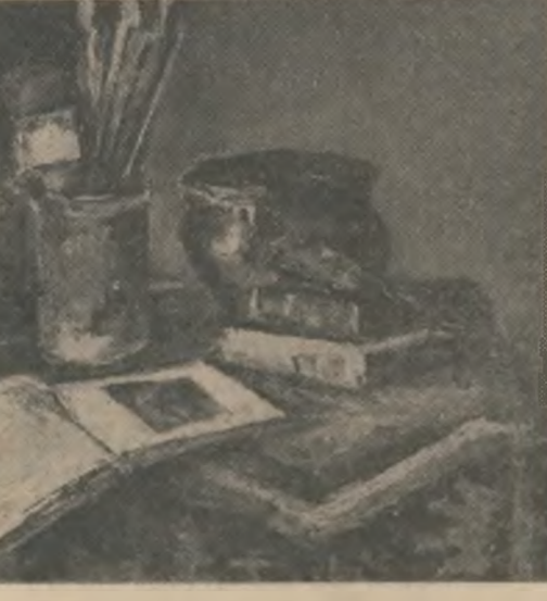
Gheorghe Petrașcu: „Natură statică”