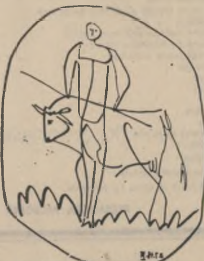
Desen de Picasso

Ca un costum nud și mutilat, cineva iese cu mine și mă însoțește. E grav ceea ce se petrece-ntr-o noapte, și nu știu unde sînt. Miinile sale singurează în gura mea, și ca mine se-mbracă și-i înșală pe toți cu numele meu și felul meu de-a fi eu. Dar dacă îi cunosc speranța mea, îi răspund că nu. Cineva a răstîgnit mînușile mele negre. Imbrăcat cu propria mea goliciune, cine mi-ar putea spune cel care nu sînt?