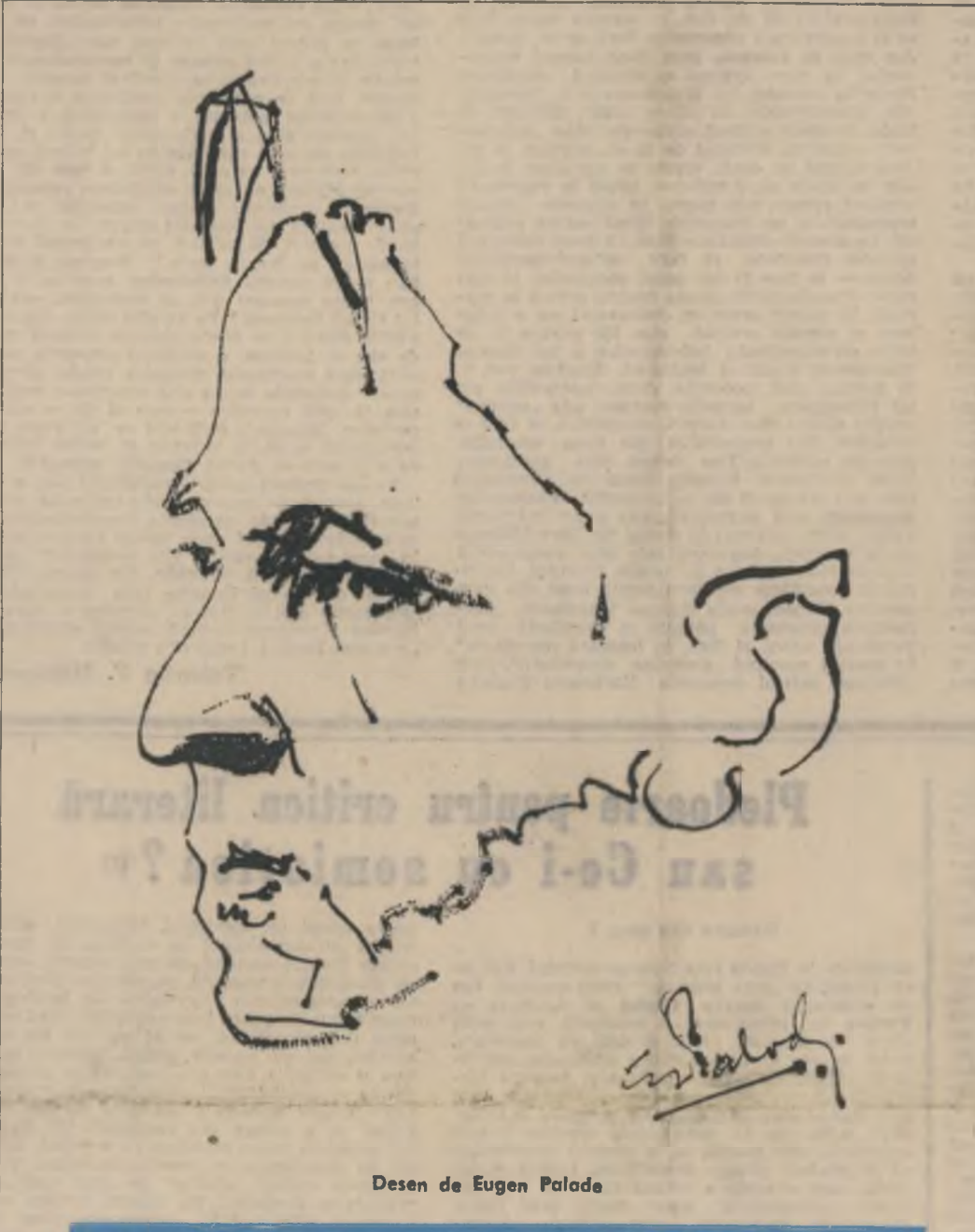
Desen de Eugen Palade