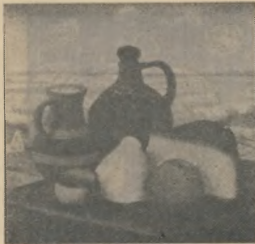
Cine vrea sa manince, sa nu manince...

I-am destainuit mamei visul meu despre poezie... A spus doar atat: Doamne, baii cimpii!