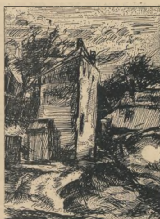
Desen de Radu Dărăngă

Cu viața cit o nucă (smerită și perfidă) în haosul fraged al zorilor mă condamnă; „du-ți viața (smerită și perfidă) în fal și fal de incriminări” asemeni unui miez de nucă creierul meu se cuibărește comod. Viața smerită și perfidă, o nouă suferință: în stupul harnic, nevinovat, un cuțit fioros, implintat.