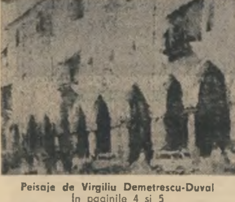
Peisaje de Virgiliu Demetrescu-Duval În paginile 4 și 5

Sămînta-i femeie ce naște și moare Sub fîpătul pruncului biruitor. În templul răcorilor fragede Pornește caosul vieții și-i numără Clipele cumpenei pînă se-stuneacă Sub dulcele-i rod orbitor. Vesnicia păstrată în carnea Din bobul pînăte — ofar din timp — Se cheală toată prin verdele scrum. Nu voi mai fi niciodată Dăr sint să mă bucur acum.