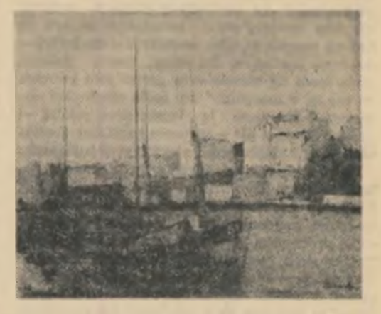
Iași, 1886. Să afiă această însemnare un alt țel? Și care anume?

Argumentele invocate sînt demne de toată atenția. Nu se poate însă trece alături unor poezii menționate la Ioan Nădejde care a donat manuscrisul Bibliotecii Centrale Universitare din Iași, și care s-a simțit obligat să pe coperta de gardă a fiecărui dintre cele trei caiete să noteze: