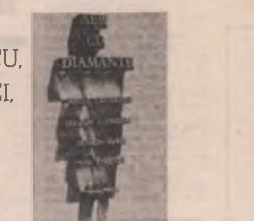
Mircea Cărtărescu et al. Aer cu diamante

«... generația în blugi» vede cum «copilul care eram își scoate capul prin țoracele mele de acum și îl bretonul lui drăpănez folotile și lampadarul într-o hua de briantă (...)