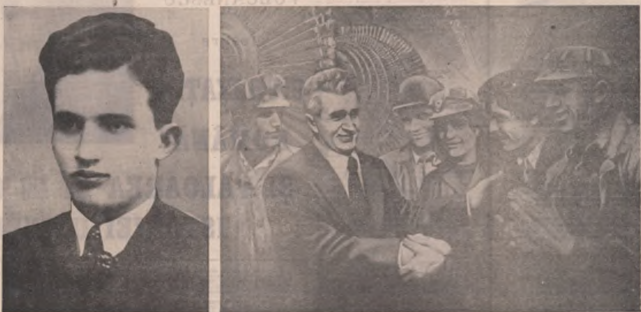
Tovarășul Nicolae Ceaușescu în octombrie 1933, cînd a fost ales membru în Secretariatul C.C. al U.T.C.

Dar, începînd din 1924, Uniunea Tineretului Comunist a fost silită să intre în ilegalitate. „Vem continua lupta noastră cu o dublă energie! Dacă a imposibil de a activa legal, vom lucra ilegal” — se arăta într-un document al vremii. Și, urmînd pilda comunistilor, utecitșii s-au simțit de cuvînt! Organizația revoluționară a tineretului a putut, a simți să reziste pe baricadele luptei sale. În condiții de adîncă conspirativitate U.T.C.-ul îninea, sub diverse forme, lăcșura cu tinerii muncitori, țărani, intelectuali. Utectitșii luau parte la comitetele de front unde constituie în întreprinderi din București, Turu-Severin, Galați, Arad, Timisoara, Ploiești. Ei și-au intensificat activitatea în sindicate, în societățile culturale, sportive, studențesci și în atenele populare. În perioada 1929—1933 organizația comunistă de tineret a analizat cu temeinicie cauzele reale ale înrăutățirii condițiilor de trai ale muncitorilor punîndu-le în strînsă legătură cu existența crizei economice. Tinerii au condamnat repormarea sînceroasă a luptei muncitorilor din țară și din evenimentele de la Lupta începutul ridicării valului revoluționar din România. Tineretul