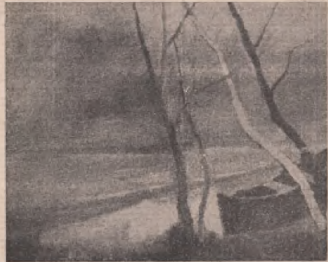
Matilda Ulmu: „La farm” (Din expoziția deschisă la Galeria de artă ale Municipiului București)