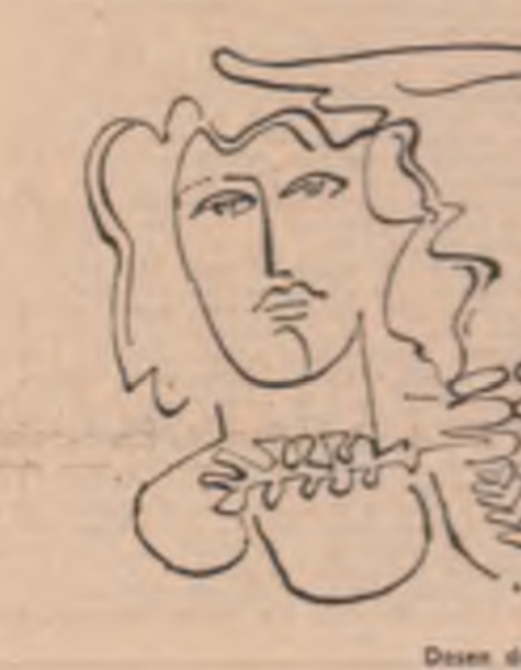
Desen de Beona Șubăit