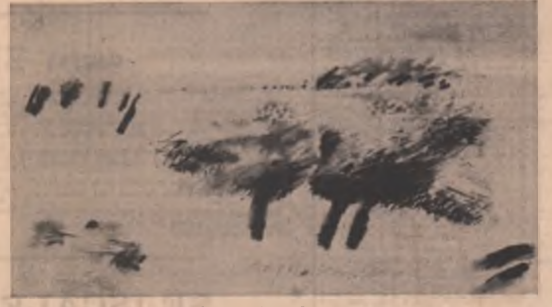
Grafică de Raluca Grigoreca