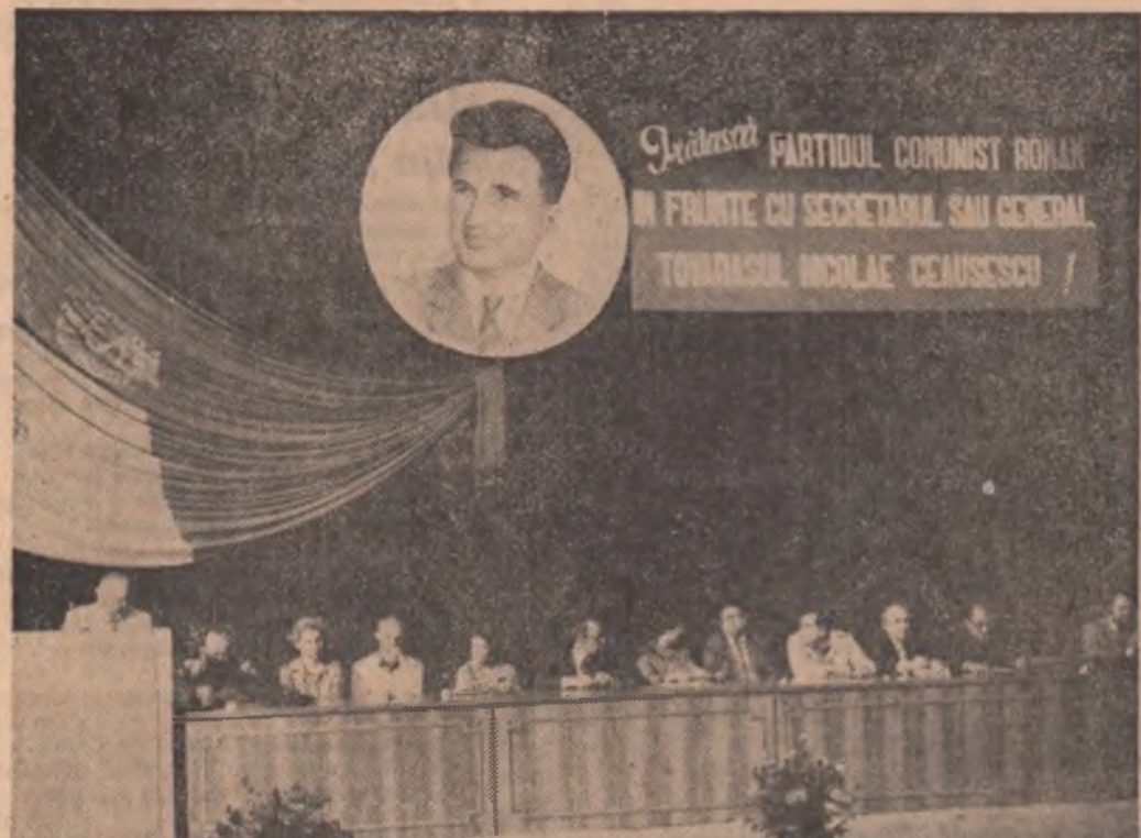
Secvență de la simpozionul „Oamenii de cultură și pacea” desfășurat la Tirgoviste sub auspiciile Uniunii Scriitorilor din R.S. România în colaborare cu Uniunea Compozitorilor, Uniunea Artiștilor Plastici, Asociația oamenilor de teatru și muzică și Asociația cineaștilor.