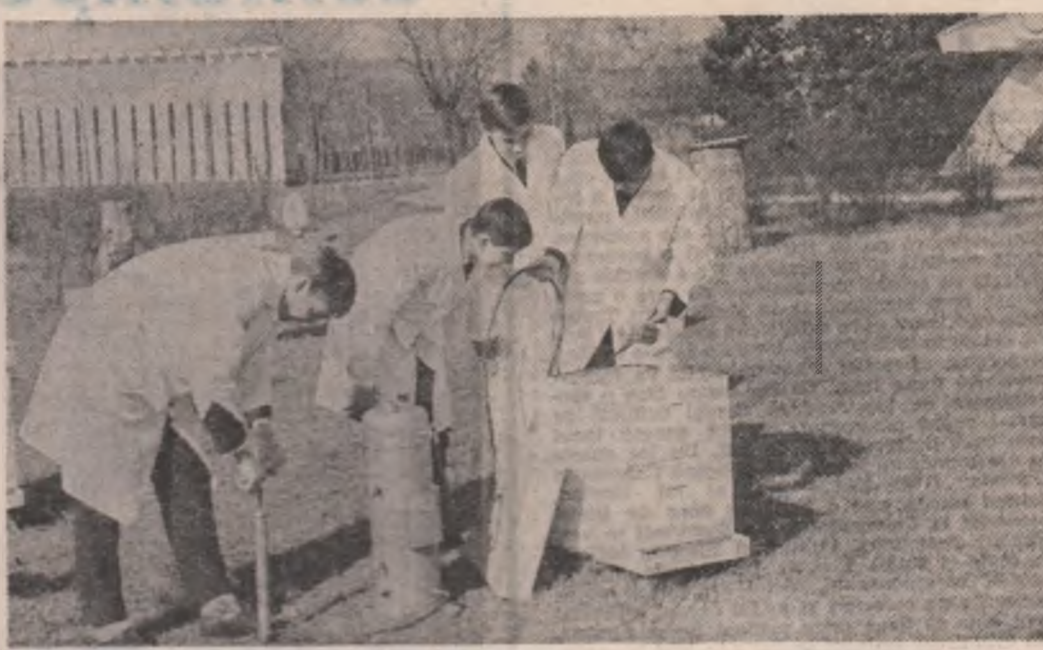
Școli... albine... elevi... muncă și...