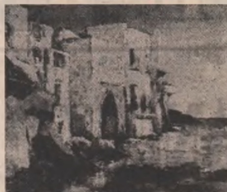
Peisaj de Virgiliu Demetrescu-Duval