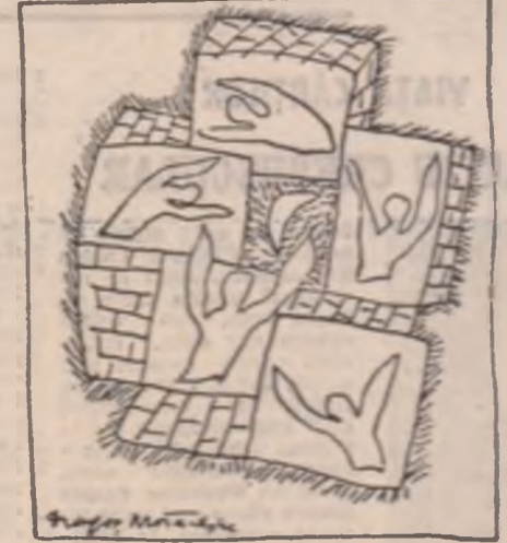
Desene de Dragoș Mîrăreșcu

Mașina asta a strălucit ca un bălăc și sculptor Opel Capone, negru, care rula linistit, fără grabă, cu servotele valtoare și-o curbură pe grătarul portbagaj de descurcarea. Încoace se aflau un barțoc, și înmăia și doi bălăci. Lello începu să se țină în spatele lui: străbătura astfel piața de la San Giovanni și, încet-încet, ajunsese la Via Cassiana, în răsturnarea Torpignattarel. Sășistele hotărîtoare ale torilor germani. Acolo totuși era pustiu, toare și doar mașini. Opriți călătorii, stîna, vîșe perșocal și descalide, și intră înăuntru. Trebuia lucrat într-o oarecare înalțată să lăsa hamalul să se înclădească. „Care ai omoroi?” lă tine?” șopti Cagone. „Eu?” făcu Tommaso, scoînd unul din acele botece americane cu