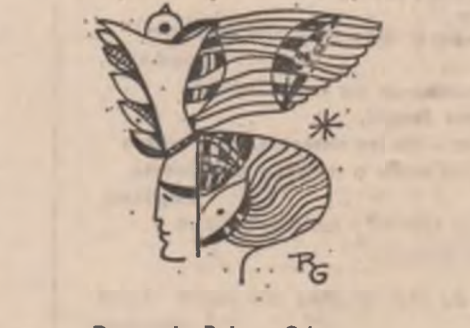
Desen de Raluca Grigorcea

Acel iepure alit de real, alit de plin de spațiu prin măluri simoase, de umbră vinețiu cînd coborîrea-i o scăpare în luna-colică, e fericierea mea, mersu-i prin fantasmă, prin arame curse în zori, prin țesături de iele o a naștere, Naștere, de-I vezi țtii să naști și aceli iepure asudat în fiecare apus, în lăstariș de artari, zălud înalțat spre Ramură albastră spre Steuca polară poate sint eu cu miinile de aur cu pleoapele de vînt, trecînd în rit.