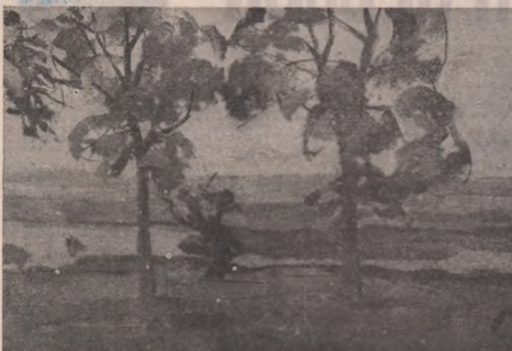
Benone Șuvăilă: „Frasi”