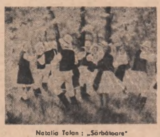
Natalia Tolan: „Sărbătoare”