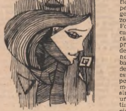
Desen de Liliana Niculescu