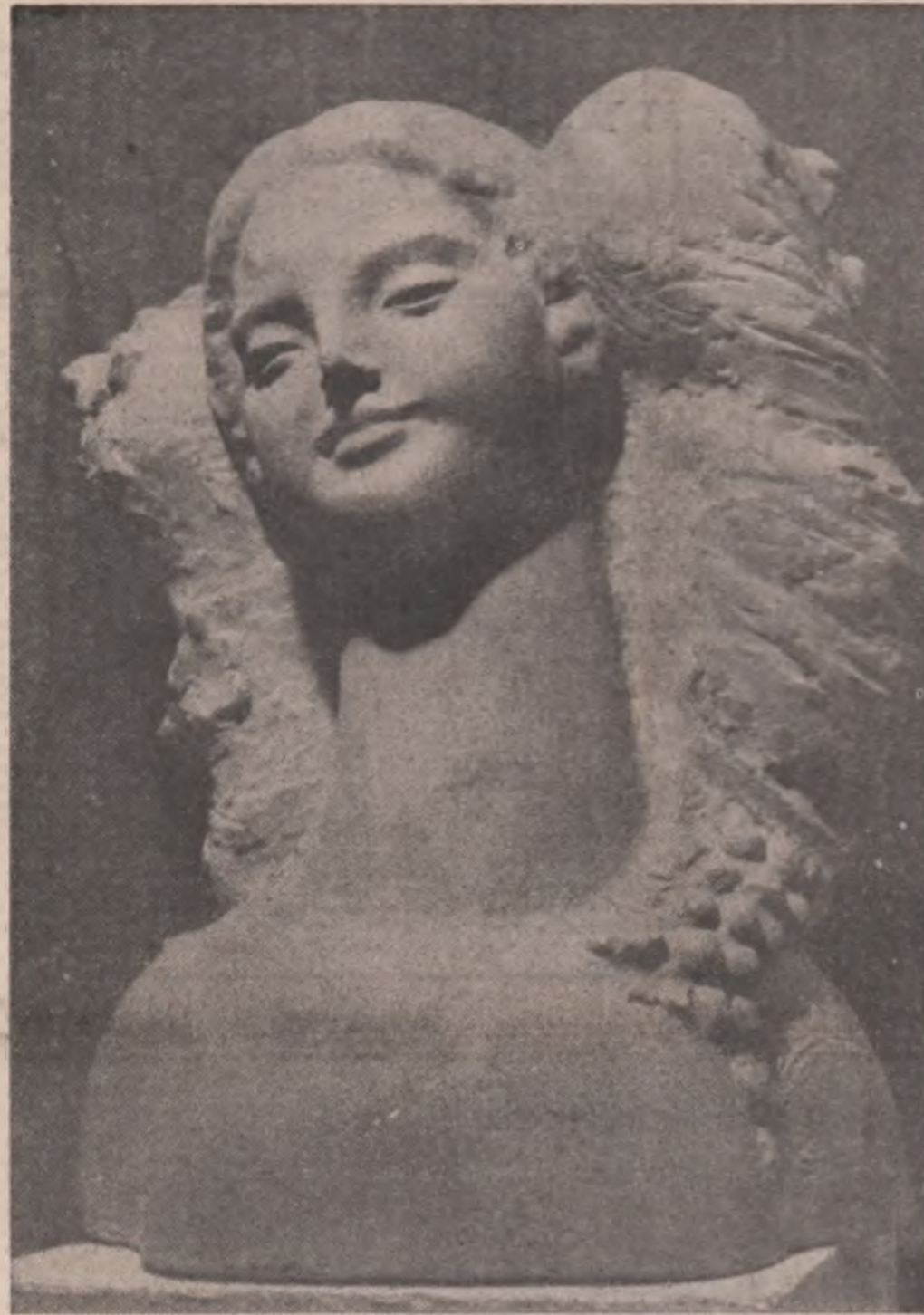
„Rod” — sculptură de Justin Năstase