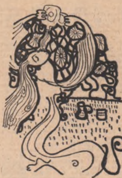
Desene de Liliana Niculescu