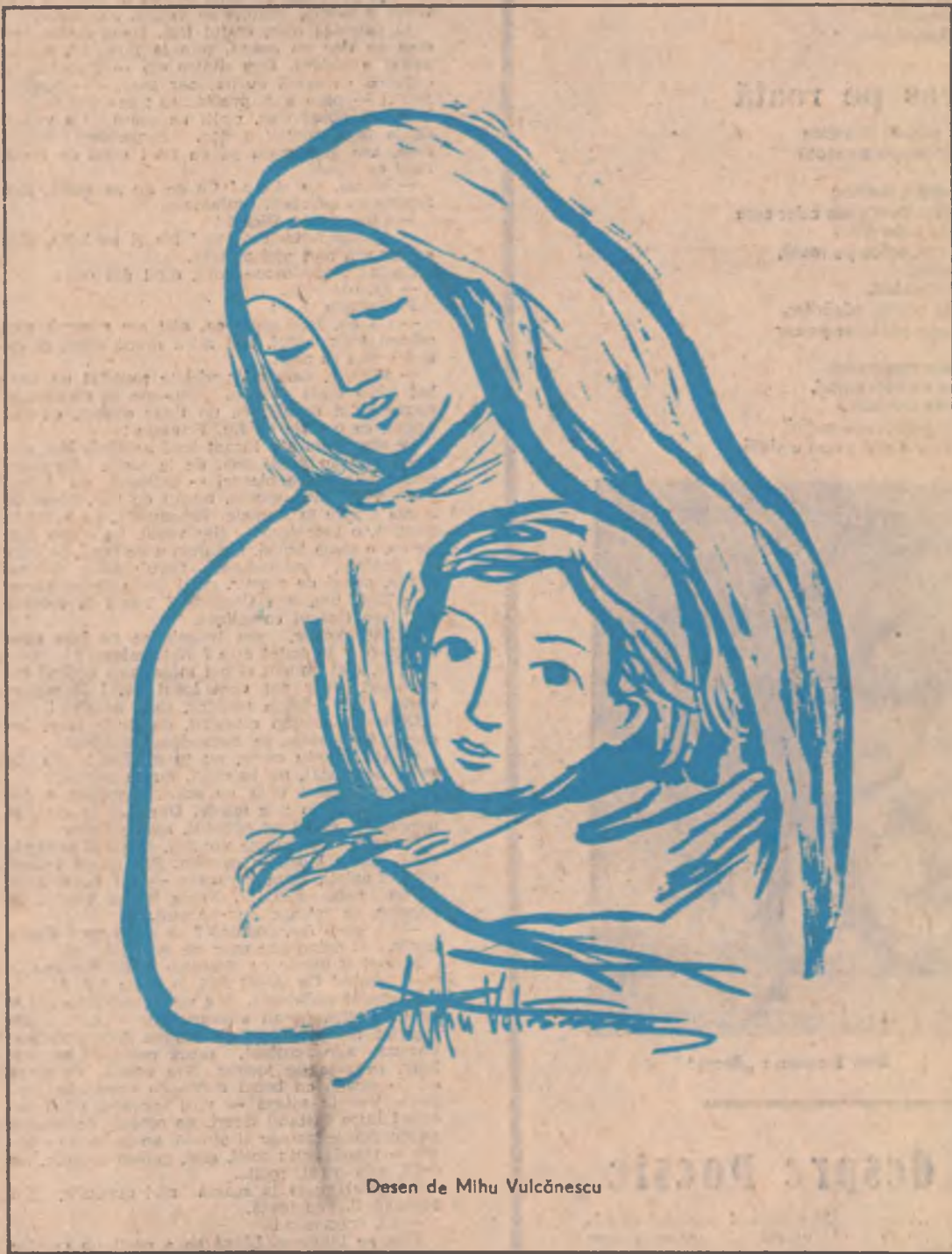
Desen de Mihai Vulcănescu