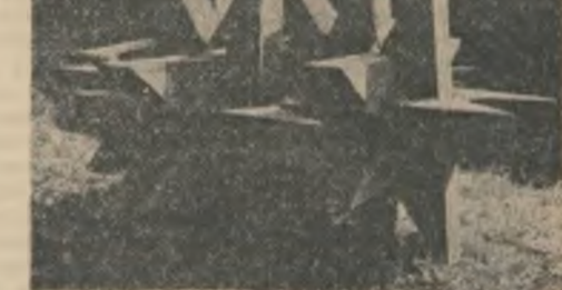
Sculptură de Mihai Olos