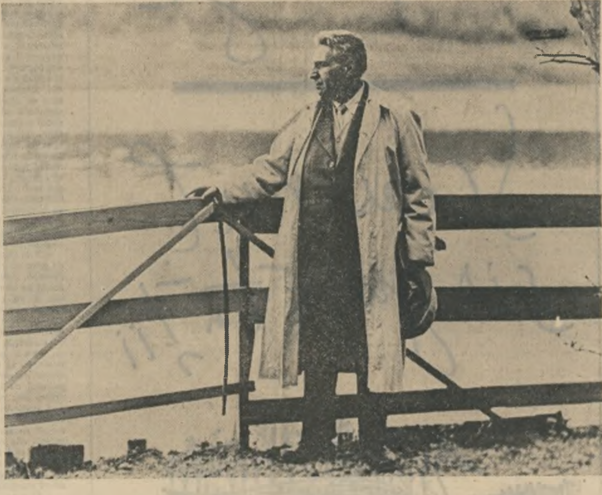
Sub acest titlu revista „Luceafărul” va publica o serie de amintiri despre G. Călinescu de la cei mai apropiați colaboratori ai lui. Rubrica rămîne deschisă și pentru toți cei care l-au cunoscut pe marele critic și doresc să ne trimită amintiri revelatoare despre activitatea acestuia. Nu intențimăm o rubrică de amintiri mîrșite, anedotice, ci o suită de amintiri care să profileze mai ales dimensiunea spirituală a personalității lui G. Călinescu.