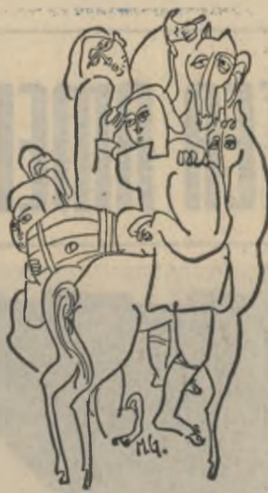
Desen de Mihai Gheorghiu