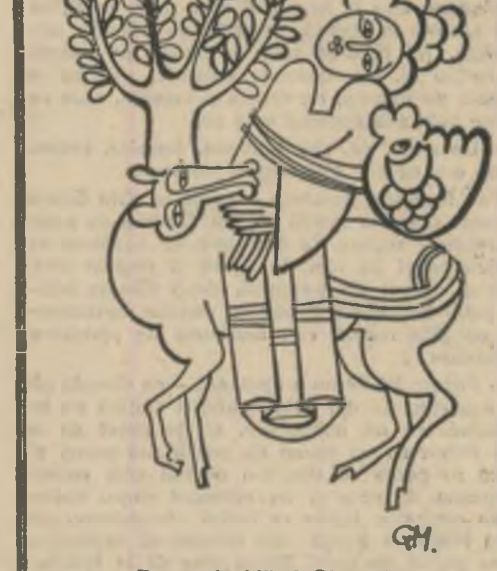
Desen de Mihail Gheorgha

Leagăn al lumii ce nu se ferește de sine.