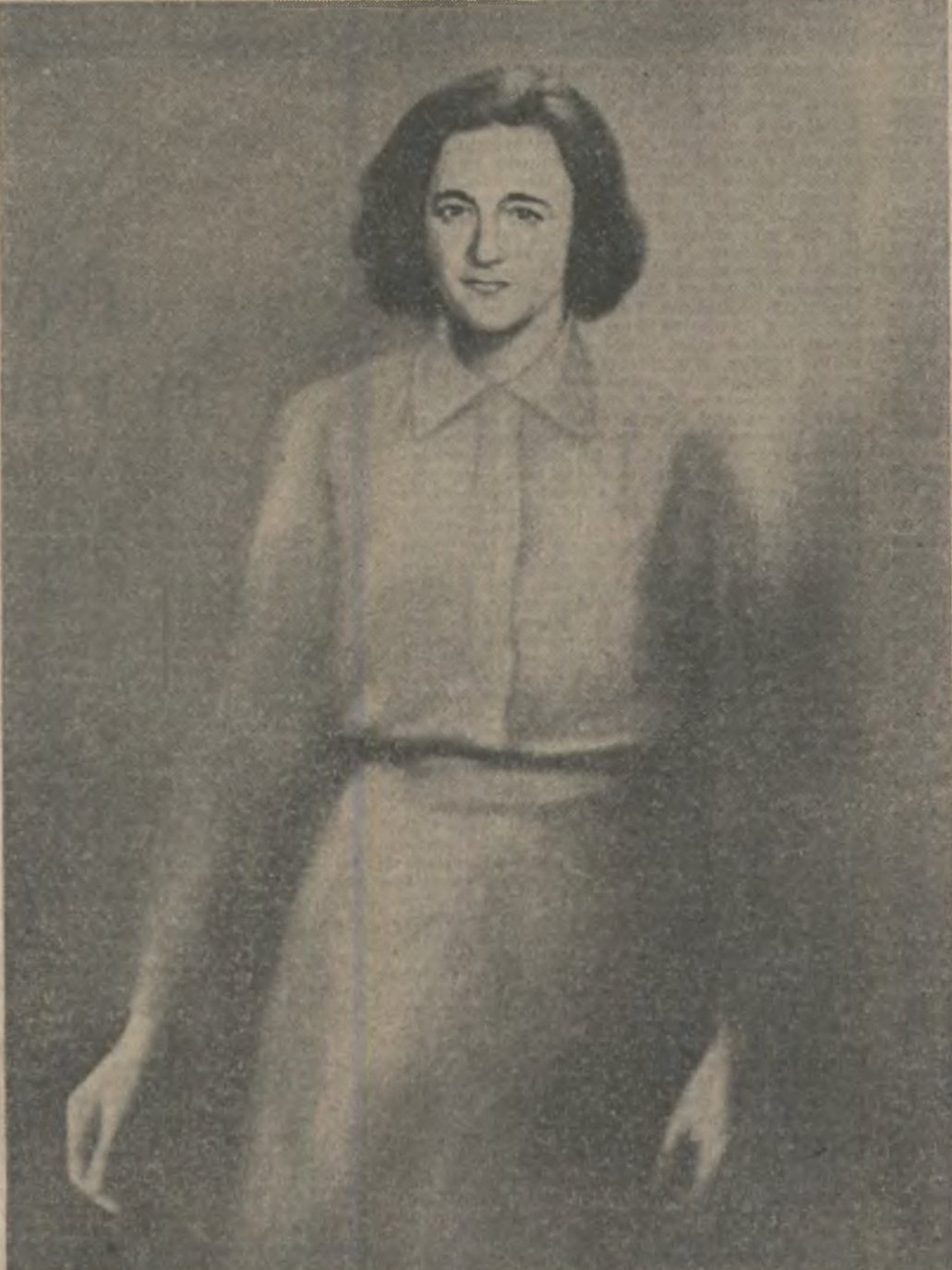
TOVARĂSA ELENA CEAUȘESCU — pictură de Corneliu Brucosu

Alături de Eroul modernei României, De cel ce ne conduce destinul de a fi Uniți între hotare, cu dreptul nostru-n lume Ca Patria Română să albă pururi nume, Fiți umăr de odihnă spre timpla lui vitează Fiți vis ce se-mplinește și fapță ce visează! Într-un buchet de slove — tot flori înmiresmate Vă-aducem o urare: „Ani mulți în sănătate!”