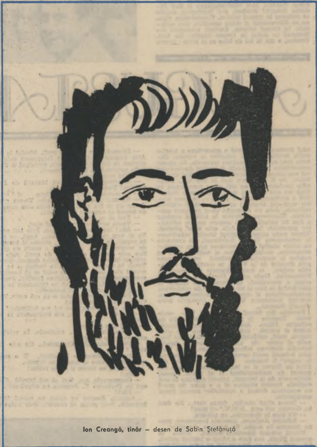
Ion Creangă, tînr — desen de Sabin Ștefănuță