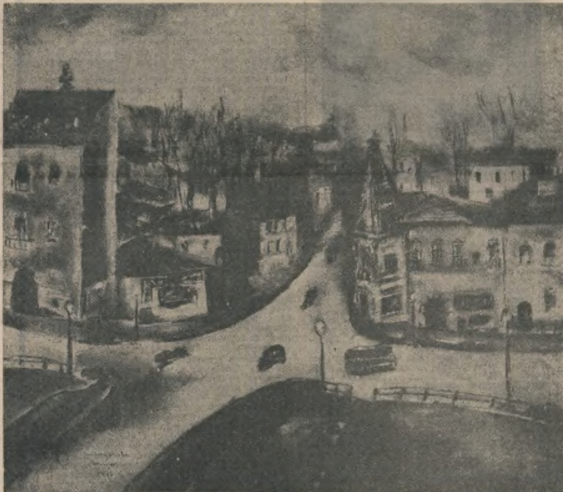
Margareta Sterion : „Paisaj bucureștean” în paginile 4, 5, 6, 9 și 10 alte reproduceri după tablourile artistei