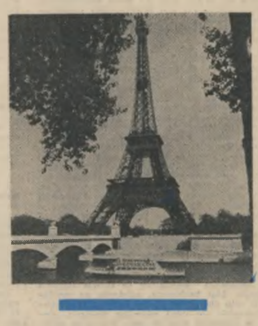
centru funcțional pentru viitor. /.../ Palatul, care este admirabil, nu funcționează ca un muzeu; ambiția mea este să-i dau o infrastructură pedagogică.