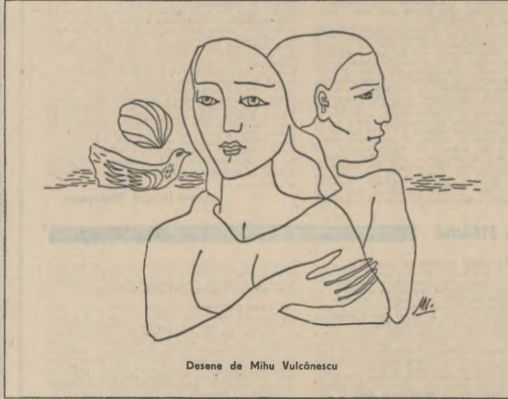
Desene de Mihai Vulcănescu

RADOVAN PAVLOVSKI Steaua albă Voi fura dubul acestui pămînt Și cîm măs să vă voi Negru zăvorăște-mă în ochii ablaștri Luita măcar o dată Nu va fuți în cele mai întunecate nopți. BEGDI IARMAN Lupta Marele cap înfășurat în turban și ochii larg deschisi și se invirtese în toate părțile. Mustățile din nou aburite lar cînd ești rînit cu străduitorul suris chipul și-i amărăsc... Veți merge și veți muri În numele luptei mărețe Mai apoi va veni primăvara Va veni și glasul de pasăre. Fiule, ochii mișgîtoși al mamei Precum rarele frumoasele flori ale Sunei Ziua va veni, fiule, După ea sufletul În fața ta o armă va veni Vor veni și rînițele tale Și singele tău Lupta Va veni focul care distruge livezile Mai întâi moartea va veni, fiule, Moartea ca o rochie albă de mireasă. In românește de Dumitru M. Ion