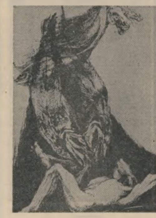
În casă țilhăreș'e. Tata întinde mina după tesli. Unul îl lovește în cap. L-a ameli. Se reped la el și-l leagă ducîndu-l din căpeștre la ispravnic. Pe bătrînii îl string cot la cot, în streanguri cu furorul dat cu ceară. Pe celiții îl duc din bice. Sint pierdută. Femeile ielesc a mort. Minăm ca vitele după e.

în bordele, la adinc. Lupul băi întînderele, sub cerul de plumb. Cu botu-nrîpt în neguri urliă lupoaice bulgărești. Agonească moartea cu coasta spută și floarea trasă peste zăpezi; năvălesc hăte răzăcte din Burmaz, potopinoacă, dă l-a saivanele zgribulind sub crivăț. Focuri aprinse și oameni cu tălângi ce le mai tin. Nebună, pădurea e nebulă, copacul nu mai e copac. Stejarii cresc echelele nopții, învalții în bezele ce ciocotesc.