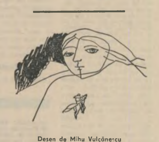
Desen de Mihai Vulcanescu