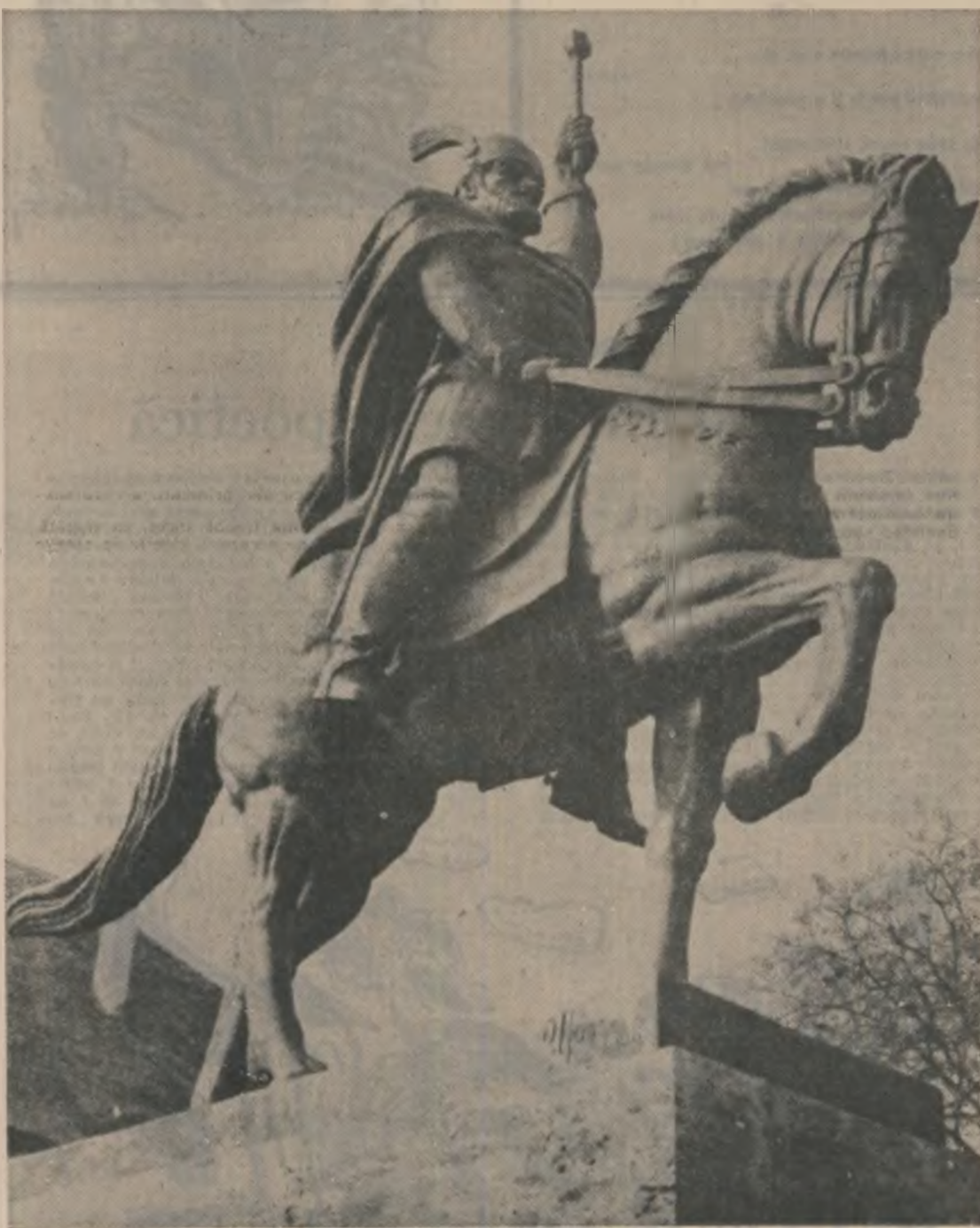
MONUMENTUL LUI MIHAI VITEAZUL DE LA ALBA IULIA — bronz de Oscar Han

Dumineca Dar eu stau din nou pe prispa ta Adulmecînd griul din axima caldă Rotîndu-mi zborul, de cunună de munți Să-ți măsoar în doină unduirea de dor Și să-și mingii cu versul pintecul raditor Al nașterii mele