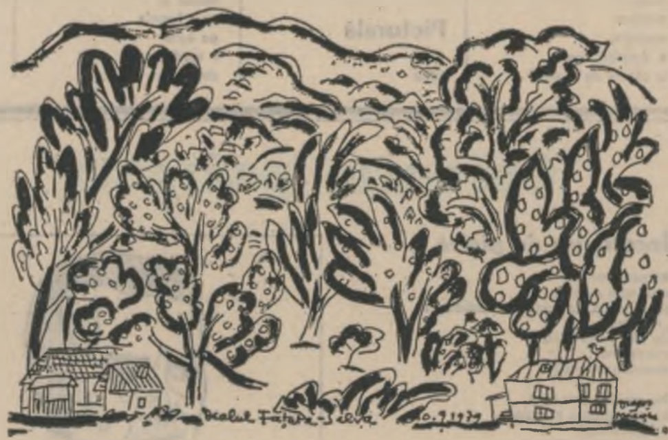
In pagina 6, 7 și 10 - desene de Dregh Marărescu

Se vinde și se cumpără cu voluptatea fricii caleștile iubirii dosesc argintării și numai către seară cite o stea rămîne strivită sub piciora prin pietele pustii