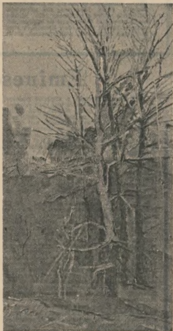
Picturi de Benone Șuvăilă

Pe marginea acestui canal se aflau cîțiva, luni dimineață, după lesirea din sul, spîlîndu-și cizmele de cațuie înainte de-a porni spre casă; poate le era somn, poate erau obosiți, fapt e că lăsseră apa să crească sub ochii lor, minunî- du-se de ea și rîzînd și chiar făcînd unele glume, ca între bărbăți — vezi că-ți ajunge pînă la...! poate că spusese unul, și ceilalți prelu- seră ideea, dezvoltînd-o, că adică nu-l primește nici nevasta acasă dacă se duce așa, cu toate alea pline de apă, numai bune de stors și de pus la uscat pe sîrmă în bătaia vîntului, cum glumesc bărbății după vreo muncă grea, dar nu-l trecea prin mîine nici unuia să ananțe, și pe cine să anunțe?, și la ce bun?, și ce-ar fi putut ăla să mai facă atunci, că era prea tirziu, dumneata dragă, canalul se umpluse cu apă murdară de ploaie, pe care veneau frunze uscate din pădure și buciți mărunte de lemn de la vreo rampă de încărcat busteni, și uite că nici mie nu-mi dădea în mîine să fac ceva, rideam ca prostul, nu mă gîndeam c-o să dea apa pe din afară, călîndu-și loc în șanțul be- tonat cu instalația electrică, unde s-a și băgat cîrind spre transformator și tabloul de coman- dă și-n lăcăsele motoarelor care pun în mișcare colivia, în sus și-n jos — și nu s-a auzit nici o tronstrău, dumneata, astea-s povești, eu eram acolo, la cîțiva pași, cînd s-a auzit ca o sfîrșit!