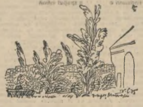
Desen de Dragoș Morărescu

Aflați despre mine că o duc foarte singur ca un tren fără cale ferată și gări că o duc în beție de toamnă-mpușcată ca o arome de struguri putrezidînd în gări ceea ce vă doresc citeodată și voi cînd de dorul cuvintelor voastre mai zac și cînd raniți de lacrimi îmi opăsă orbita cînd m-ameninți noaptea cu pedecșoa să toc oficiul că salcîmul din stînga grădinii crește orb și bețmech în brațul meu sting am în degete funze prelungi și amare să n-am dreptul să uit și să plîng îmi impresură somnul cuvinte pierdute o limbă de greieri ucis în eter n-am cu cine privi luciul vorbelor rare