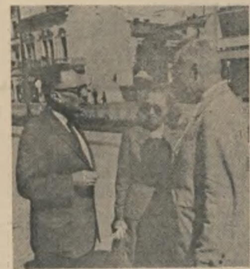
Roman Jakobson la București, în anul 1959