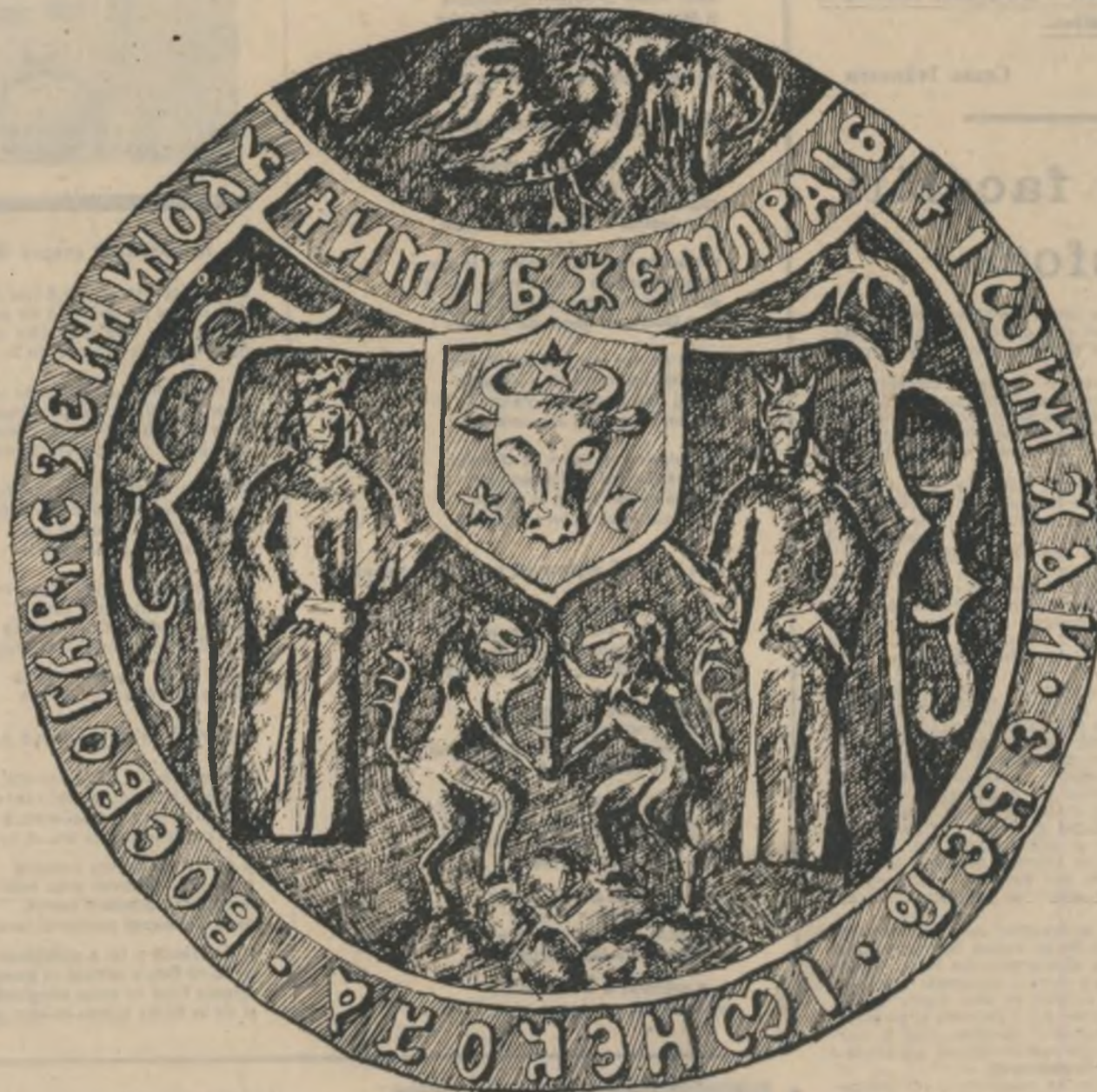
Sigiliul lui Mihai Viteazul (desenat de Mihaela Muraru Măndrea)