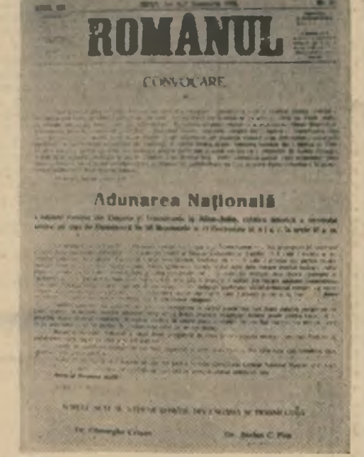
Facsimil al ziarului „Romanul” cuprînzînd convocarea pentru Marele adunare națională de la Alba Iulia

sub un singur om”. Prin urmare, turcii știau foarte bine că, în perspectivă, forța reală a celor două state românești se poate ridica împotriva lor!