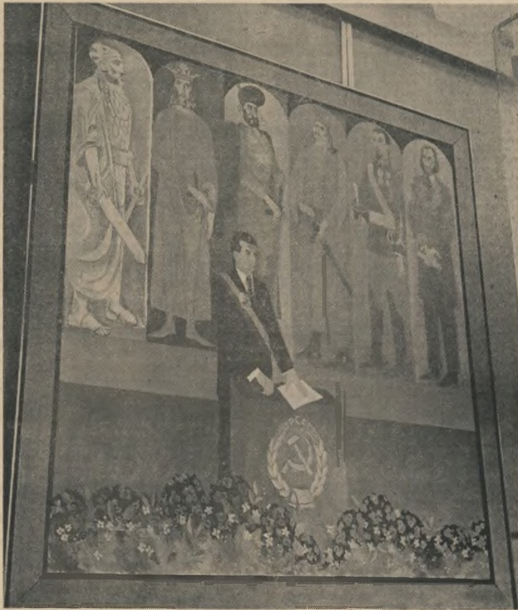
„Intiul președintei” — Tablou de Constantin Piliuță

Unirea, libertatea și independența alcătuiesc miezul istoriei noastre unice și pe cit de mari au fost ele ca aspirații odinioară, pe atît de pu-