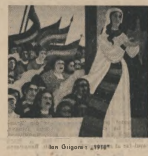
Ion Grigore, 1918

Pentru tratativele de pace care s-au purtat mai tîrziu devenit evident că România n-a depus nici o clipă armele nici după „pacea rusinoasă” de la București. Luptele purtate de noi, foștii prizonieri de război din Italia alături de forțele Antantei, actele de bravură și