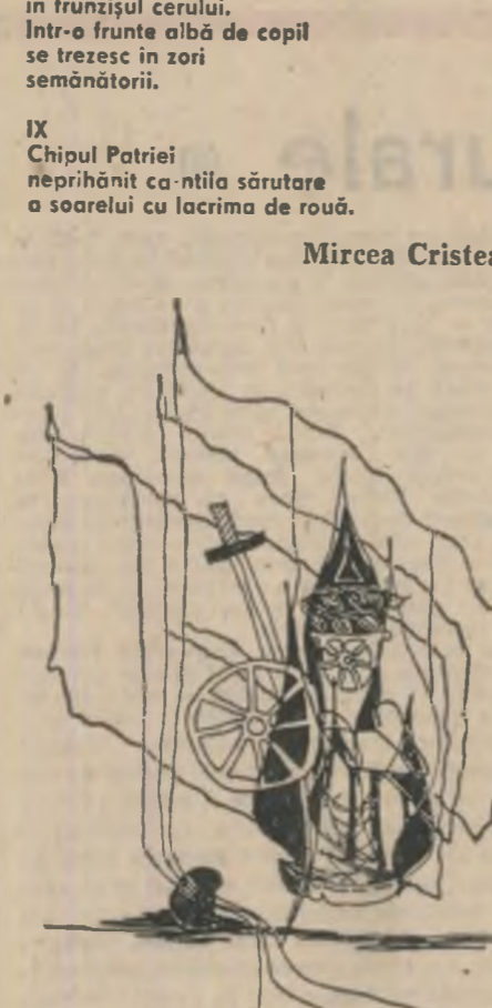
Desen de Mihaela Murariu Mindrea