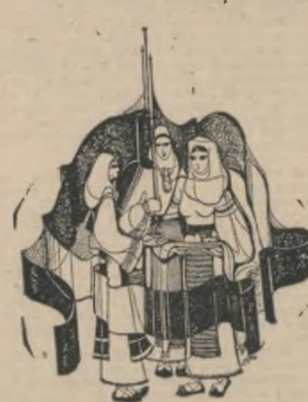
Desen de Cristina Suciuc Moscu