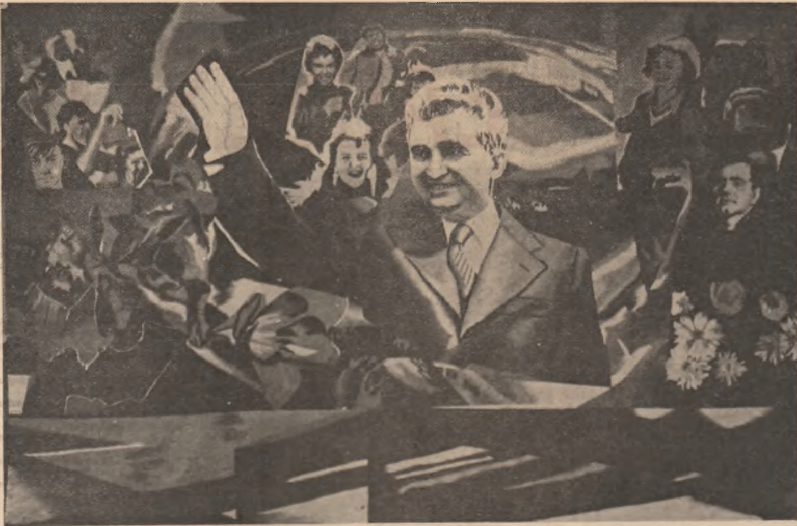
„Ceaușescu - tinerii”, tapiserie de Cornelia Ionescu