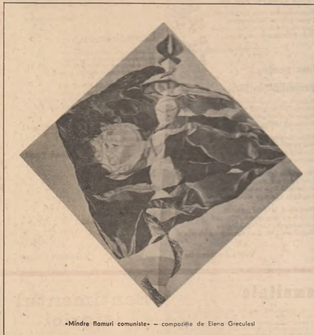
„Mindre flamuri comuniste” - compoziție de Elena Greculesi