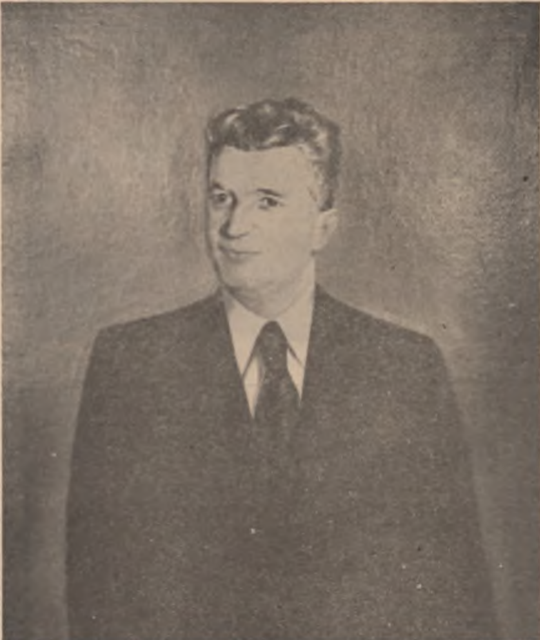
Tovarășul Nicolae Ceaușescu — tablou de Zamfir Dumitrescu