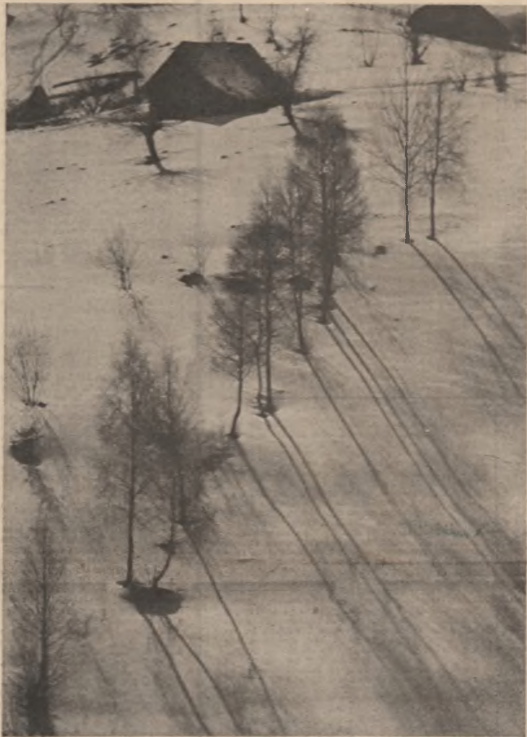
„Peisaj de iarnă” — fotografie de Sandu Mendrea