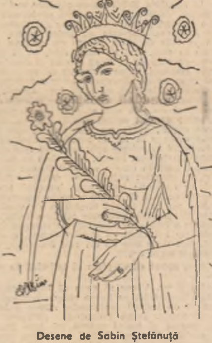
Desene de Sabin Ștefănuță

— Și? — Le-a plăcut și lor. — Ei, chiar că sînteiți cel puțin misterioși, dacă nu absurd. — Frațe, își leși din papuc regizorul, deși era desuțit — îi plăcea să umble desuțit prin cameră — tu nu înțelegi că nu-i vorba de noi? E vorba de... Keystone! — Știam că pe vremea... Keystone-lui se improviză, se dădea semnalul și actorii începeau să alerge și gîgurile ieșeau, era vremea risului în cascadă; regizorul, prin tumbule pe care le făcea, se și imagina pe vremea naveilor, spontanilor și plînelor azi de nostalgie zile ale platurilor de la Keystone. Dar aici se părea că e vorba nu de alergările defilante, nu de bălăile cu frîșcă, nu de... era vorba, deducam, nu fără crispate, despre un altfel de Keystone, pe care îl intuim mai mult decît să-l înțeleg. — Deci ar fi vorba de... Keystone, am concluzionat eu conseciv. — Exact. — E amuzant. Hai să-l facem! — Am știu noi că ești băiat bun, îmi spuse regizorul. Bravo Basil! Așa te vrem! Trăscă primul tur de manivă! — Și apoi, mai e ceva, acum e vară. Acțiune