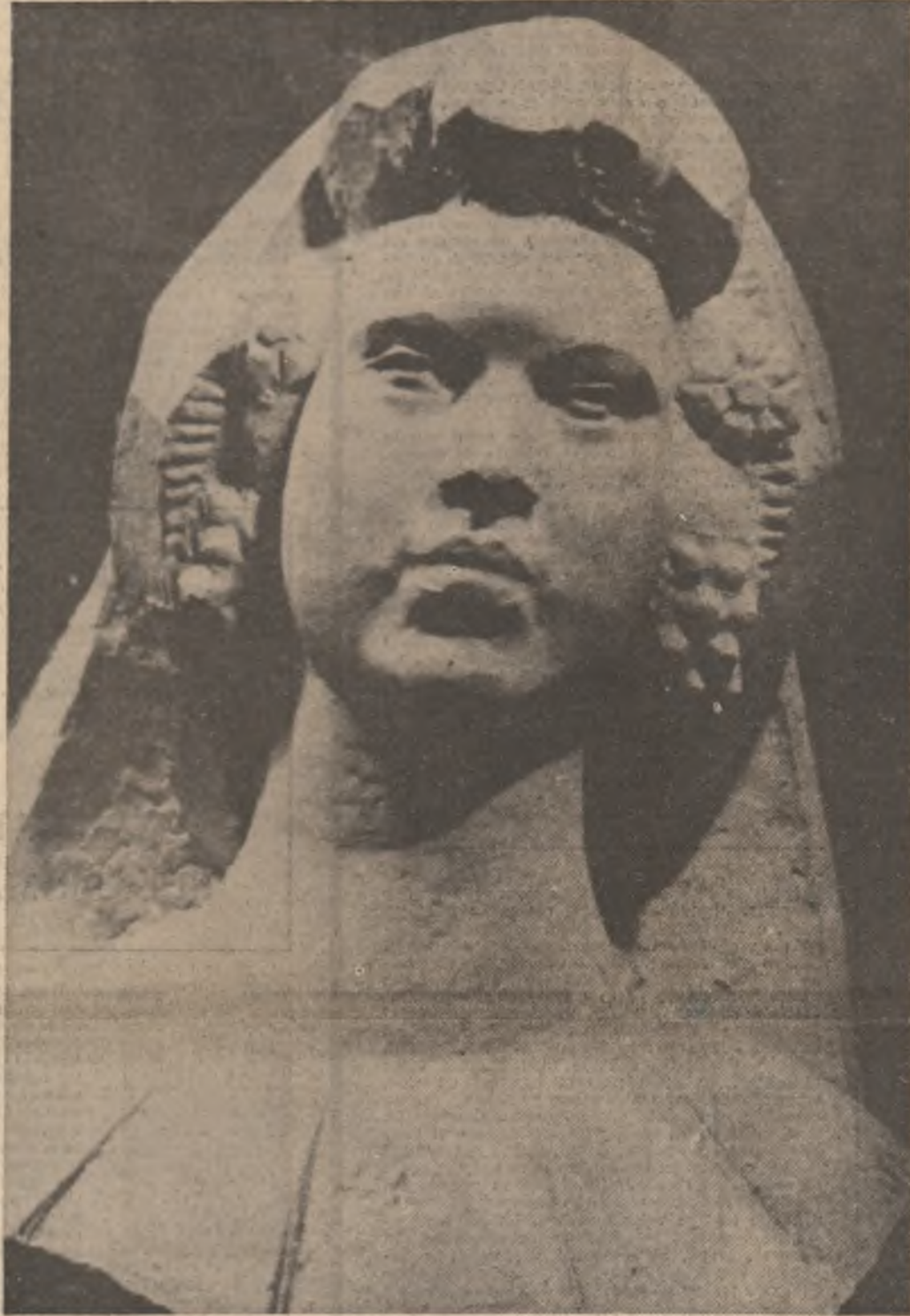
„Primăvara” — Sculptură de Justin Năstase