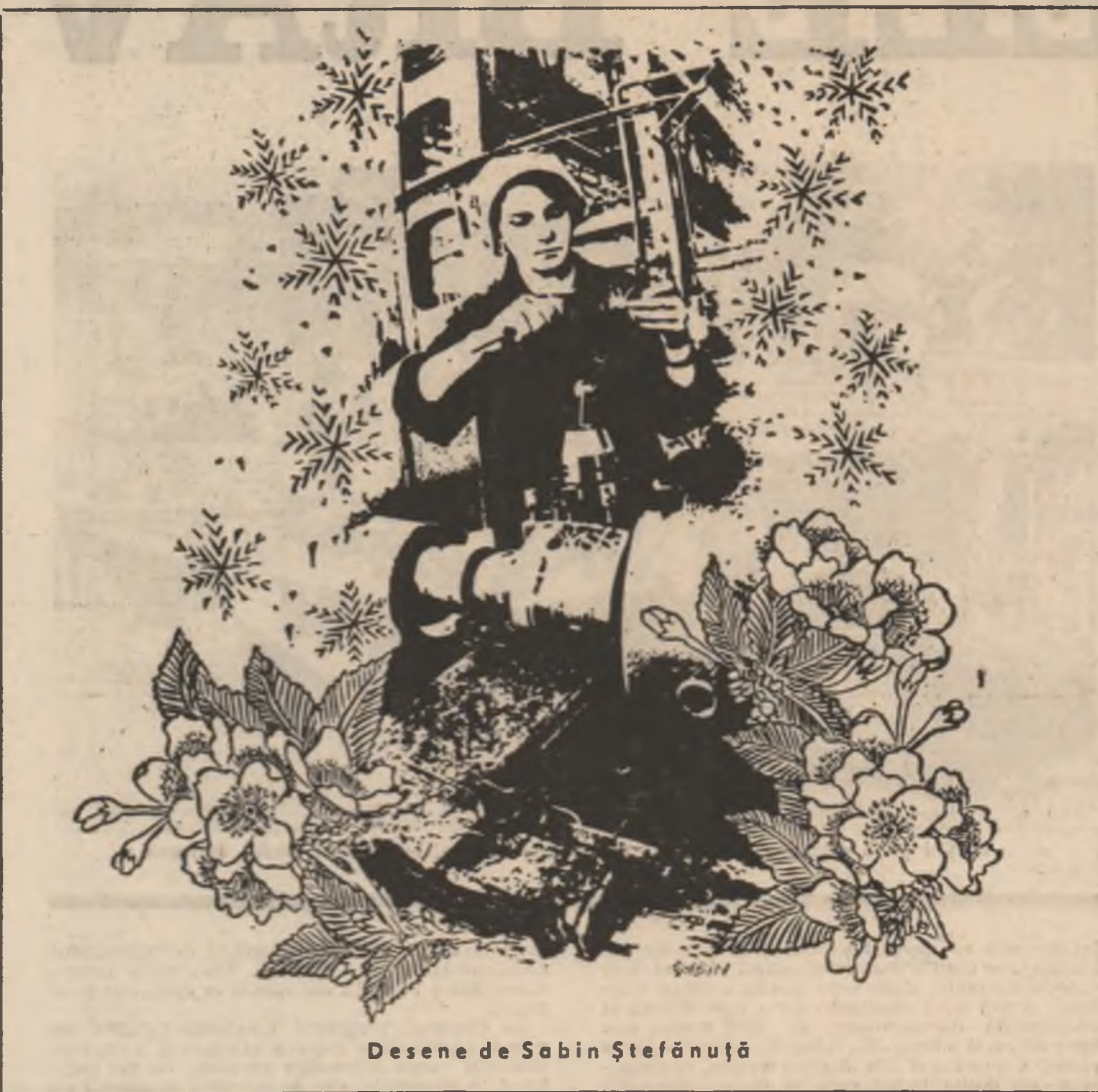
Desene de Sabin Ștefănuță