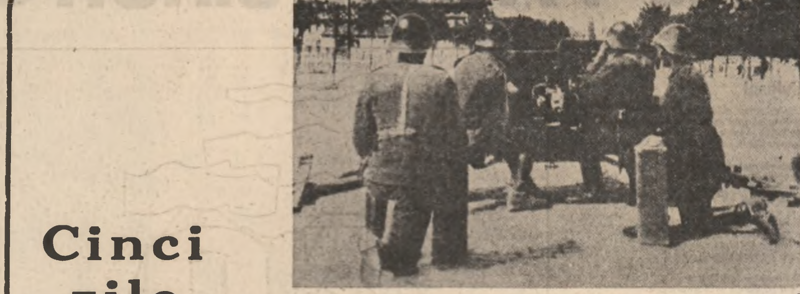
Artilerişti români deschizind focul împotriva unei coloane hitleriste în Nordul Capitalei