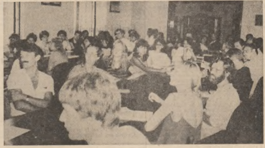
române, oameni interesați, în egală măsură, de politica alt de deschisă pe care o promovează cu consecvență România socialistă.