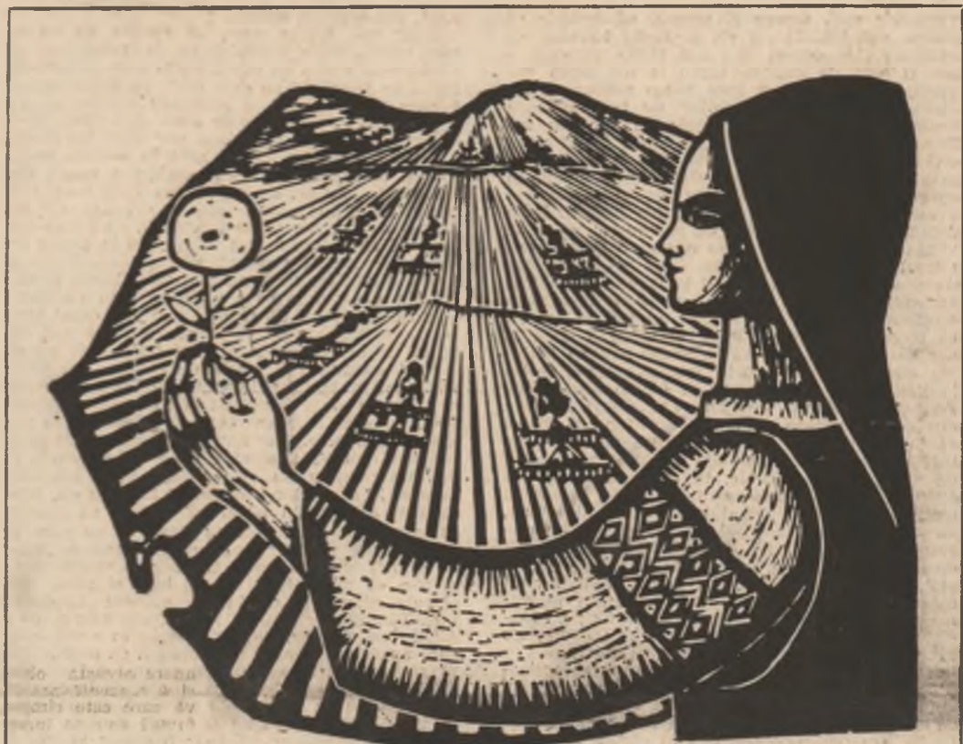
Grafică de Gh. Bojan