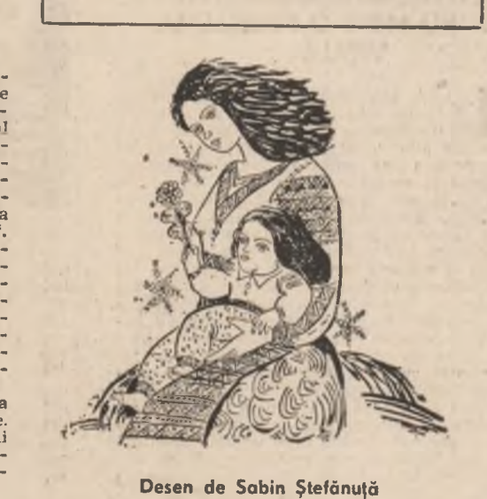
Desen de Sabin Ștefănuță