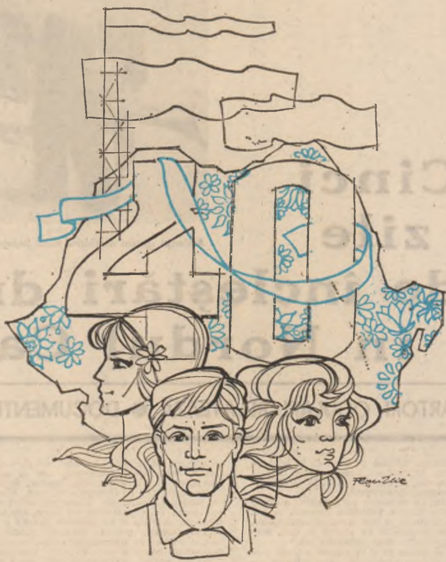
Desen de Ilie Florin