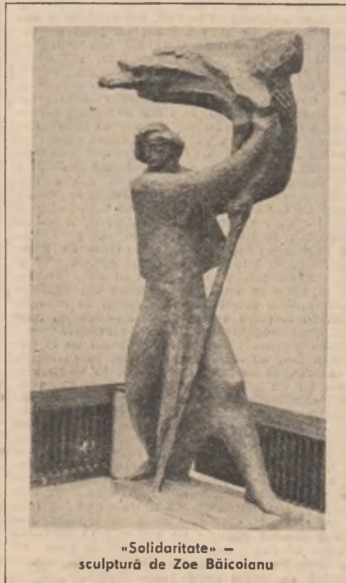
„Solidaritate” — sculptură de Zoe Băicoianu

Se scrie cu febrilitate, se scrie peste tot. Se scrie într-o pauză, se scrie la petreceri, în autobuz, în tren pe genunchi, în bucătărie, pe stradă. Și astfel nici scrisul nu mai poate ocoli ceea ce se întîmplă în jur. Implicarea a devenit o cerință a vieții de scriitor. Nimic nu se mai poate face cu un ochi rece, distant, de undeva din afară. Analizarea se face dinăuntru evenimentului și cu atît mai mult scriitorul este direct răspunzător de ceea ce scrie.