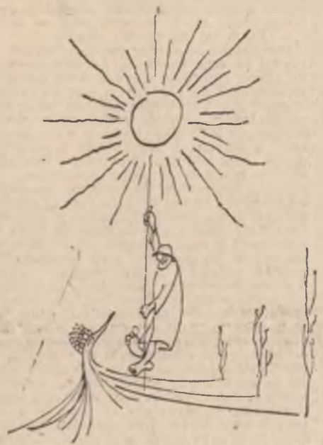
Desene de Florin Pucă