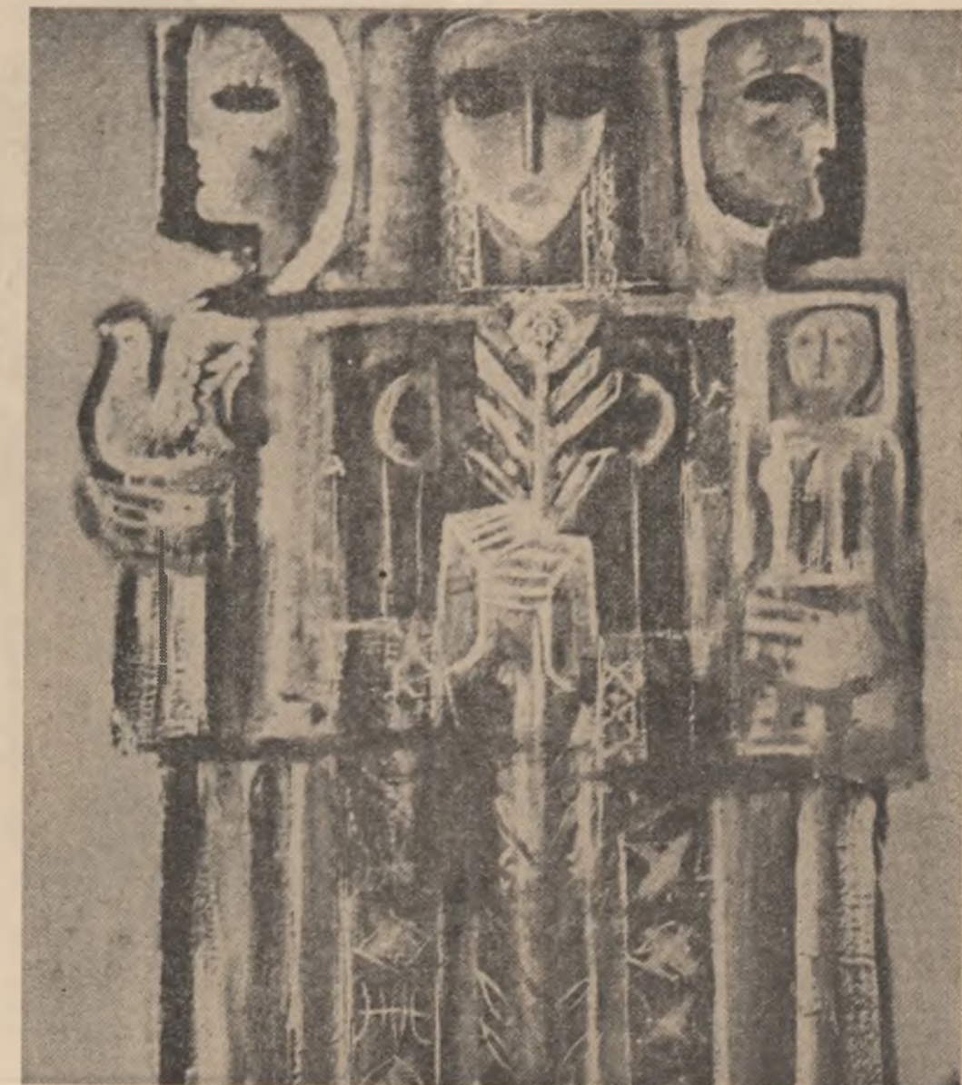
Sever Cornel Mermeze: „Rod bogat”