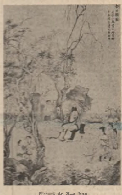
Peisaj de Ha Yan