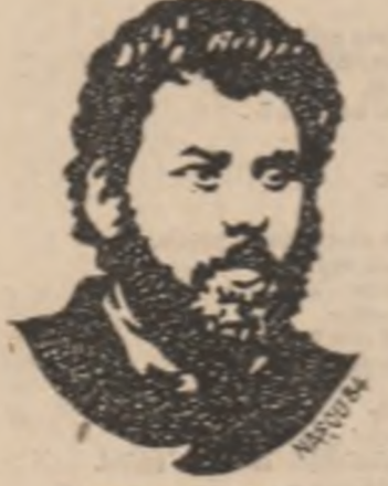
Desen de V. Nacu