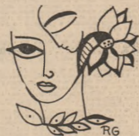
Desene de Raluca Grigorcea