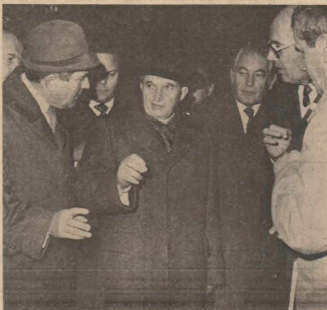
Imagini din timpul vizitei de lucru întreprinsă ieri la obiective economice și de cercetare din Capitala de către tovarășul Nicolae Ceaușescu

neral al partidului, trebuie ...să ducem mai departe spiritul ...revoluționar, să trăim și să ...acționăm permanent ca ...revoluționari, fiind conștienți ...că revoluția pe care am în- ...ceput-o odată cu asumarea ...puterii politice de către clasă ...muncitoare, de către popor, ...sub conducerea comuniștilor, ...a obținut succese mari, dar ...ca să continuăm și să în- ...trebui să se ridice la un nivel ...superior.