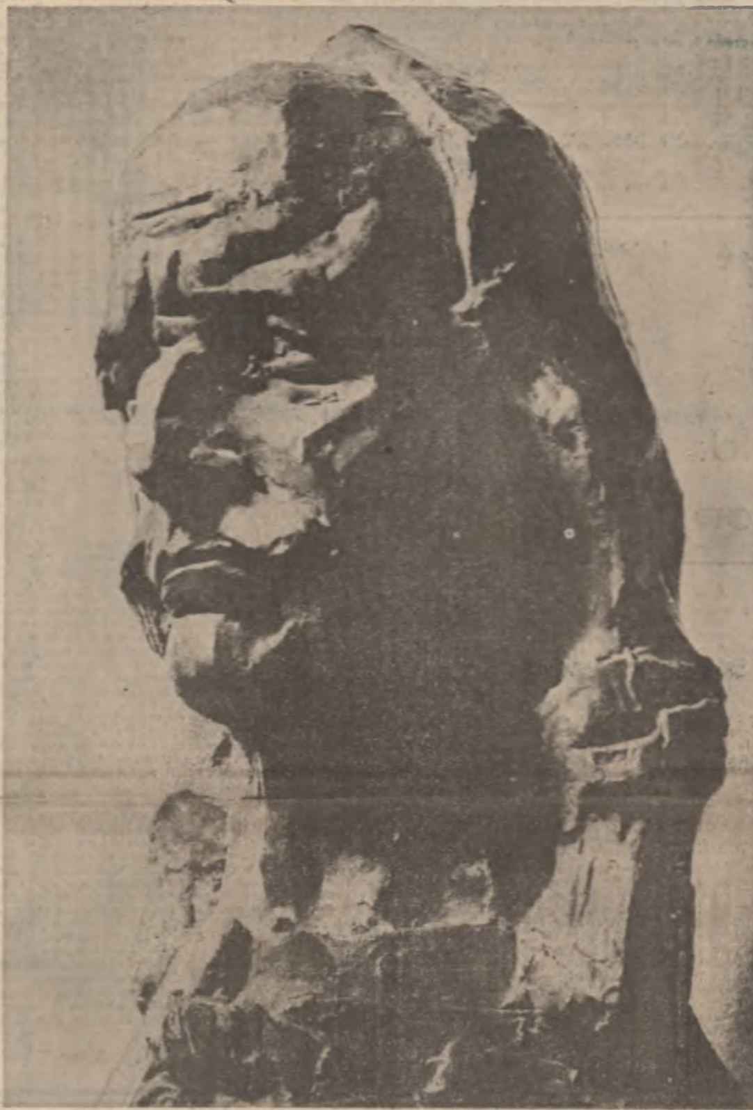
„Horea” — sculptură de Ion Vlasiu