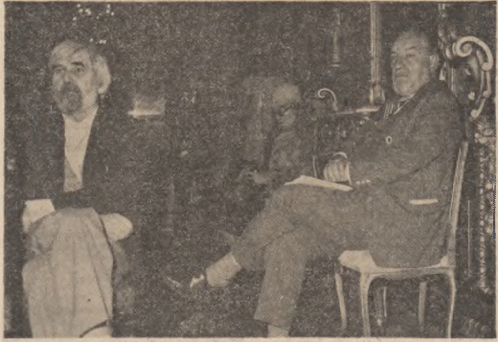
Colocviu între poezie și dramaturgie: Petre Stoica și Paul Everac