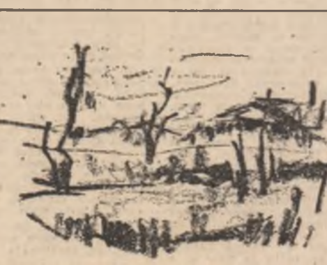
Desen de Gh. V. Ionescu

N.A. Aceste stihuri i-au fost citite lui Grigore la Otopeni, cînd, împreună cu multi colegi, i-am serbat semicentenarul,