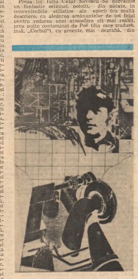
Grafică de Adrian Dumitracu