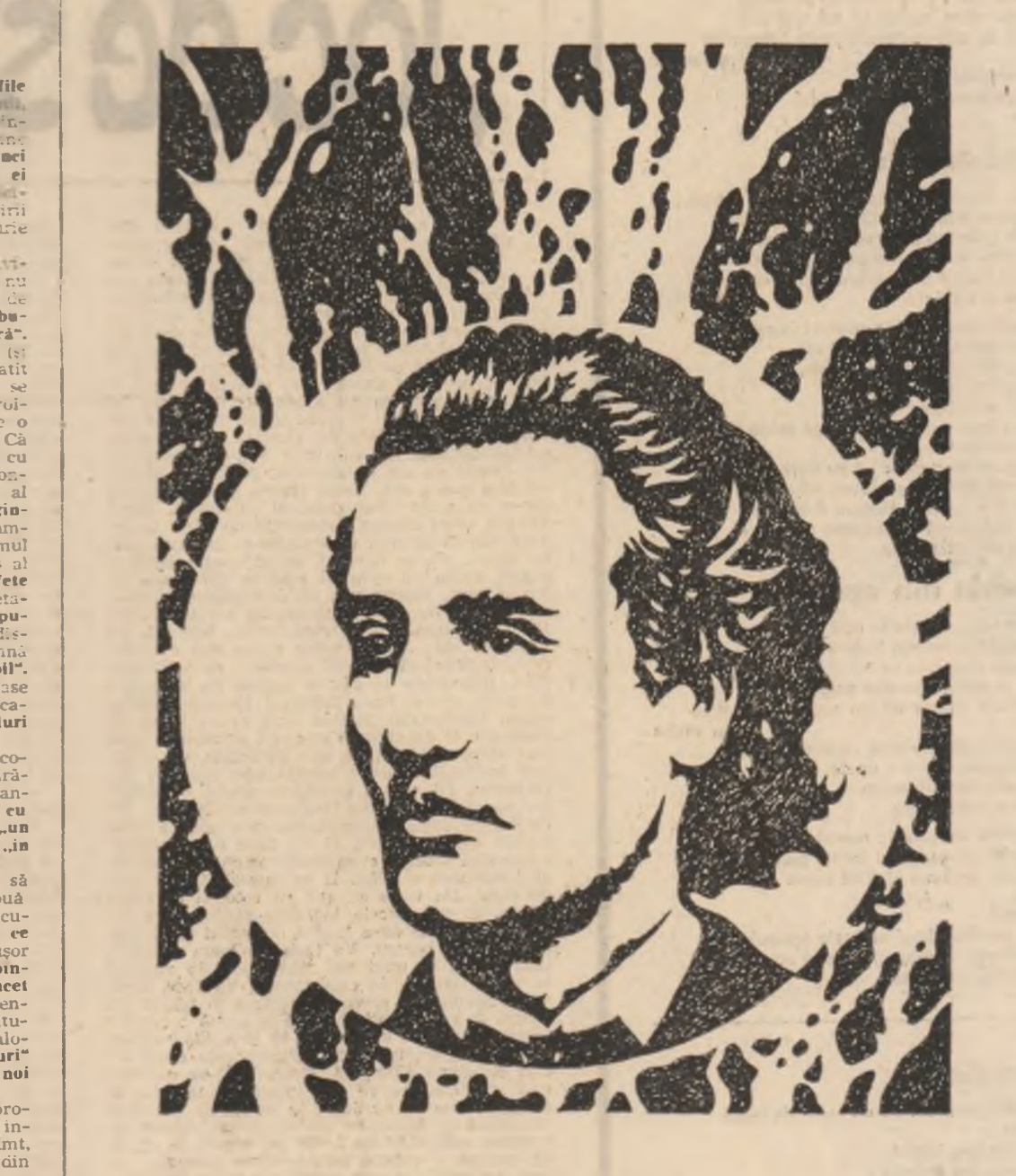
Desen de Vasile Nascu

A vorbi de humor, la Eminescu e mai propriu, pentru că starea lirică a poemului o nouă nămintă a gizeilor. Și aici, însușirea versurilor cunoaște o gradare: de la contrarietate („Dar ce zgomot se aude?”), la un condonendesc, unor disprețuitor humor („un bondar rotund în pîntec / Somnoros pe nas ca popii glasulește-ncet un cîntec”) și apoi, în final, la o fină și infon-