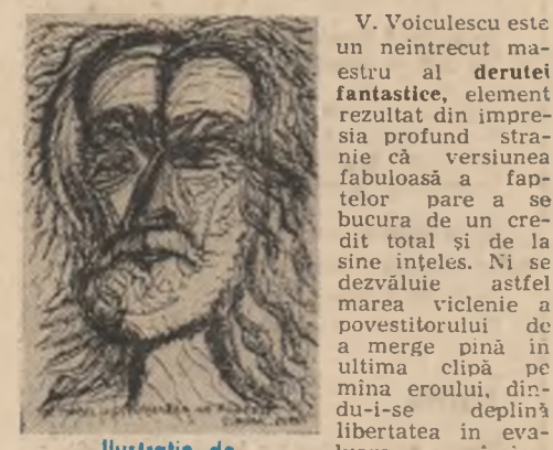
Ilustrație de Dragos Morarescu