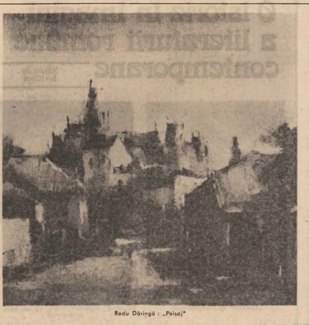
Rodu Dăringă: „Peisaj”

Eu sînt un poet citadin, În dialect autohton, Mă cuprînde cuvînt-n farmecul de dor Bun găsit iubită casă!