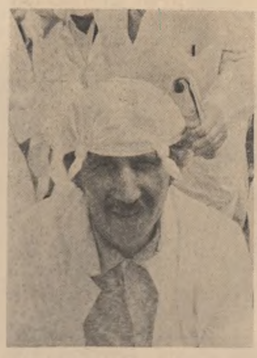
„Cenicula” de Marin Sorescu