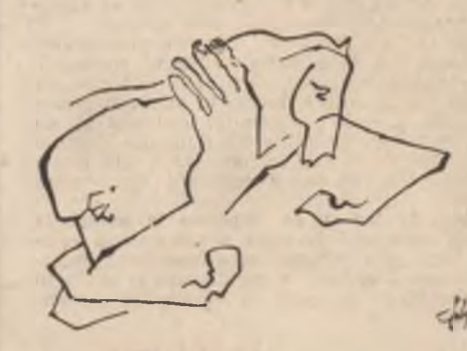
Desen de Luminița Tudor