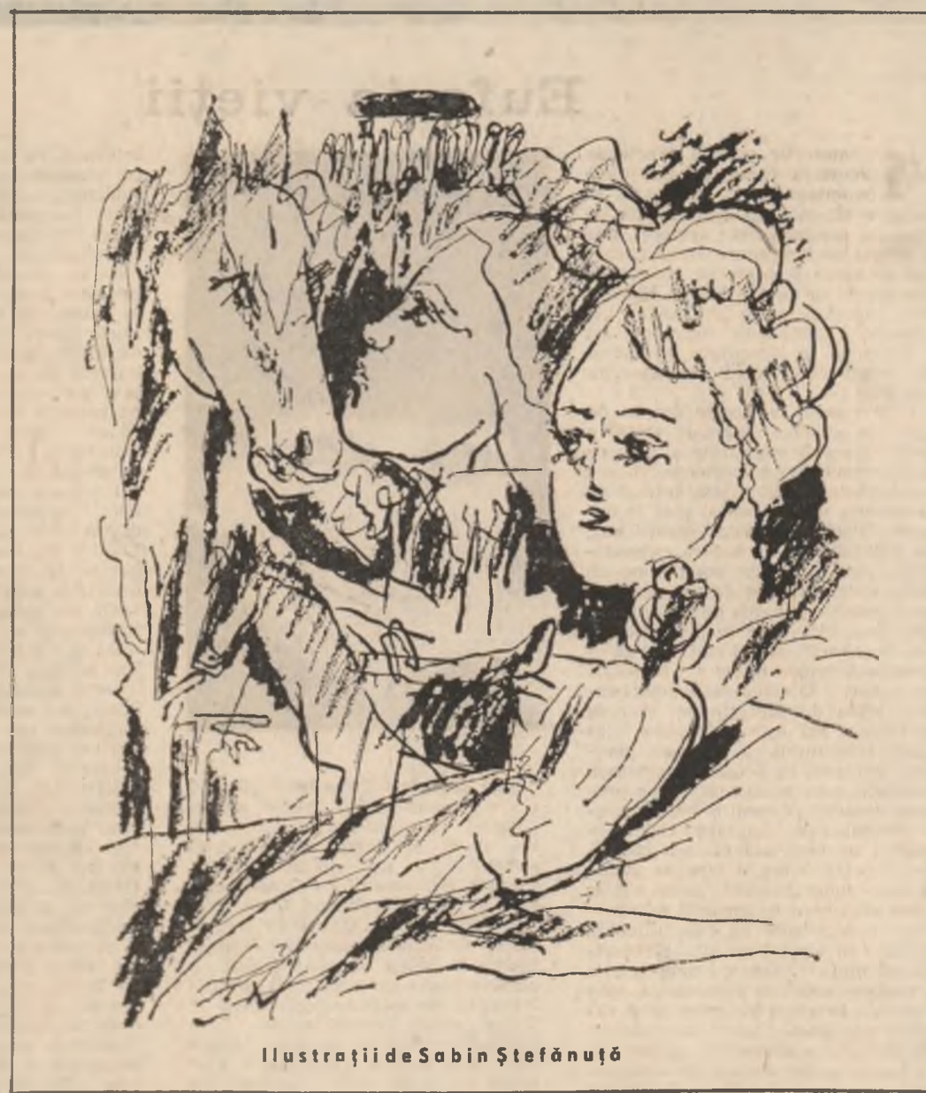
Ilustrații de Sabin Ștefanuș