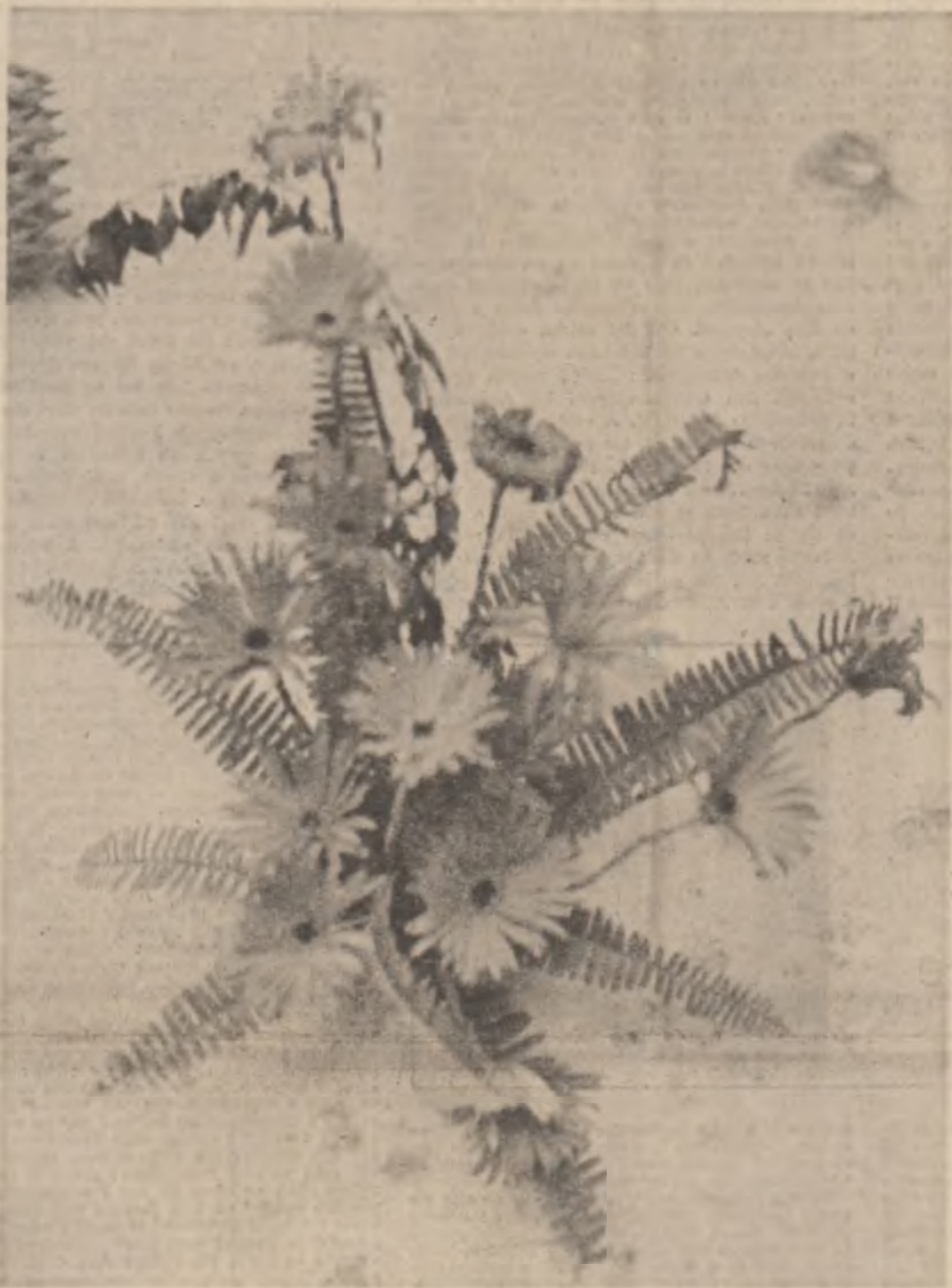
„Florii de toamnă” (din expoziția de la sala „Dalles”)