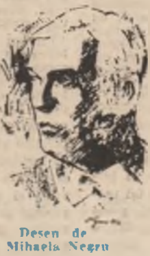
Desen de Mihail Negru

De fapt, nu e propriu-zis pridvor sau balcon. Cred că cei ai familiei Herdelea, ca și țărani din Pripas care treceau aproape în fiecare zi prin vîlul lui, îl sponesau tîrnat; tîrnatul casei, adică un coridor lung, în lungul clădirii, sub acoperișul ei, sprînjit în stîlpi de lemn, spre care se urca dinșpre curte ori din care se cobora spre curte pe cîteva trepte tot de lemn. I s-ar mai putea spune coridor, dar e o