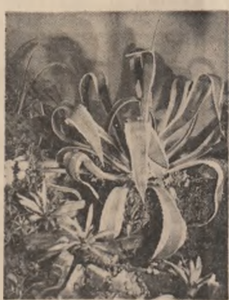
„Flori de toamnă” — fotografii de Mircea Șoanutescu

Zi de zi același truc — Din ce parte să-l apuc Și să-l bag la balamuc Pe grozavul de haiduc Care-a spart dînr-un ciubuc Tîmpla unui sfînt de stuc, Dacă-n lectica de nuc Patru-l duc, Patru-l aduc.