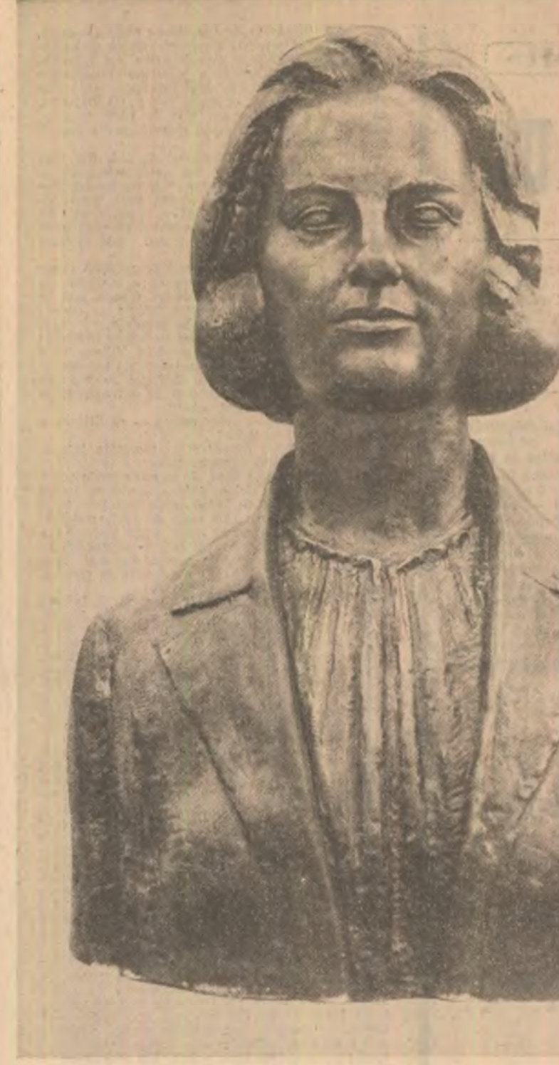
Sculptură de Al. Deacu

Implicațiile creației sale în viața chimiei și a industriei chimice românești, a științei și a economiei noastre în ansamblu lor, sint greu de măsurat în cuvînte, ele confundîndu-se, practic, cu înșeși înfloririle fără precedent, cu di-