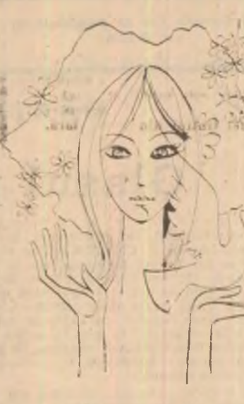
Desen de Ilie Florin

Cu orama-n mină-am apărut moșia Și-n luptă țării-s oase de eroi, Înfăcărare visurile noi Prin luptă au rodit în România.