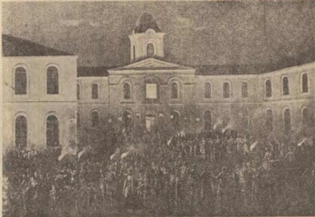
Teodor Aman: „Hora Unirii la Craiova”

„Tara este de mai mulți ani în durerile ce indrituiește o nouă viață în care are să intre. Trebuie să piară sau trebuie să petreacă ce urșita i-a însemnat în viitor. Acest fel e neatrănă sa. Nici o putere omească nu va putea să o oprască în mersul său, nici din afară, nici din intru. În desert țara a din liberă și zăis, fără principie, fără acțiune, s-au inchinat