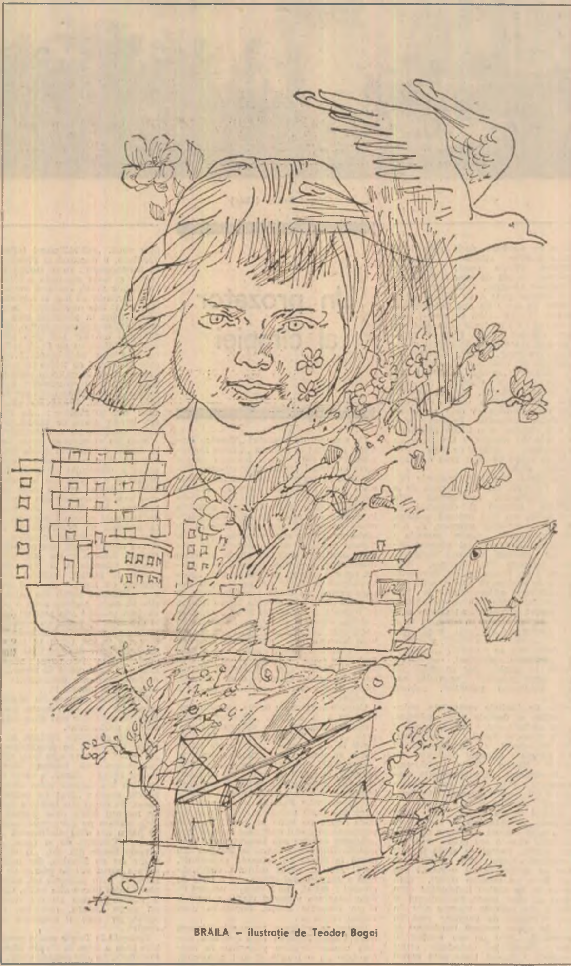
BRĂILA — ilustrație de Teodor Bogoi