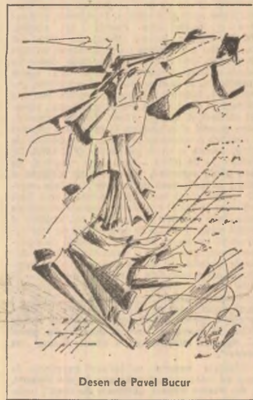
Desen de Pavel Bucur

Pe lîngă acest inconvenient care, de bine de rău, se mai putea trece cu vederea, toți funcționarilor inferiori, care constituiau, de fapt, majoritatea funcționarilor și care nu aveau acces în spatele pupitruului pe care erau cărțile cu lezi, manifestau o curiozitate bolnăvicioasă de a răsfoi și ei cartea cu pricina. Atunci au avut loc și primele tentative de a trece peste interdicție și de a pătrunde spre cărțile cu lezi. Pentru liniștirea spiritelor și normalizarea situației s-a luat hotărîrea ca această carte ce reglementează modul de plată al funcționarilor să fie mutată într-o altă încăpere ce fusese