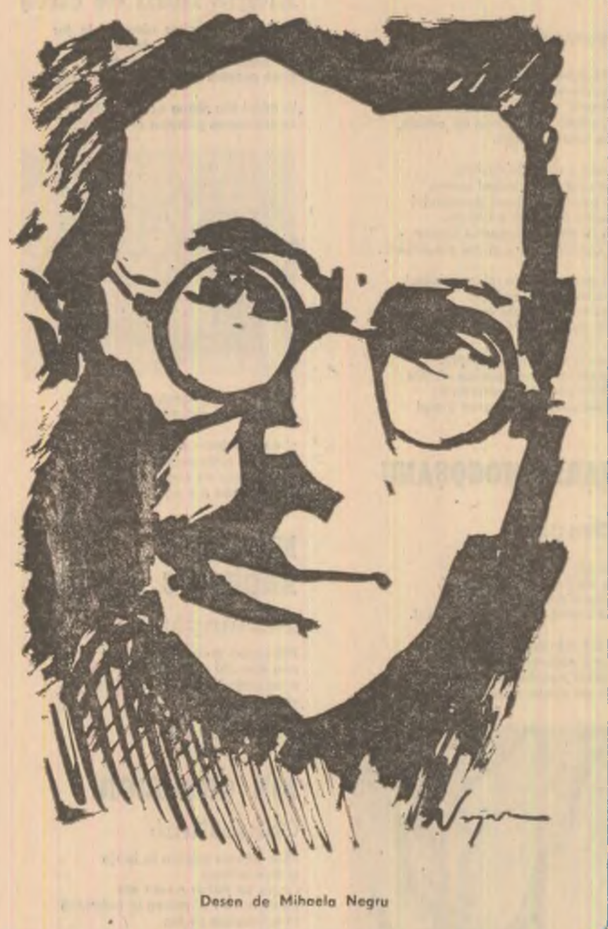
Desen de Mihaela Negru