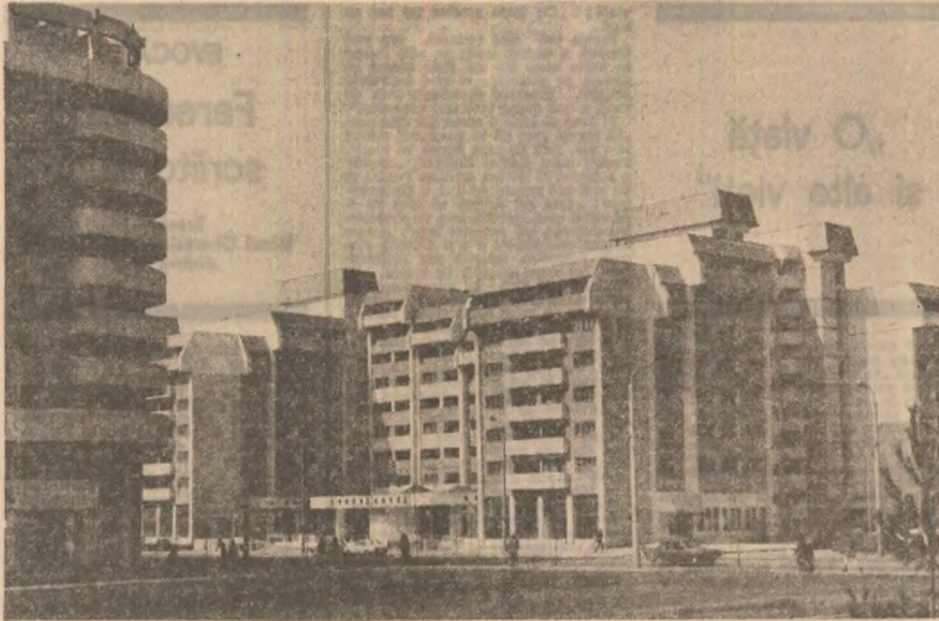
Imagine din Brăila de azi

glasul ierburilor umed tinguitor încă toșnind pașii mei în auz — nu-ți va lăsa odihnă