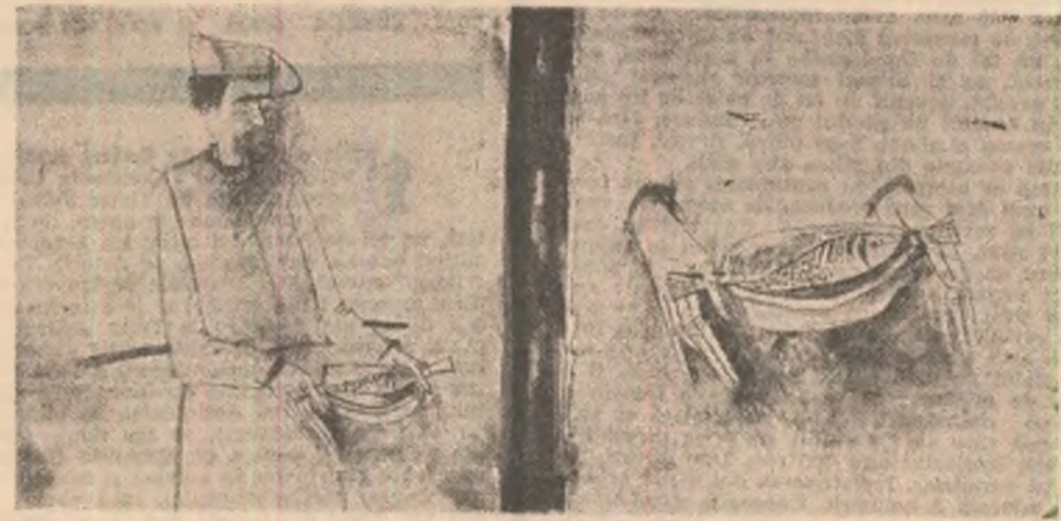
Sorin Ilfoveanu: Din lucrările expuse la Galeriele de artă din Tirgu Mureș

Cui nu-i place inima Jiului cu iubirea încrustată adînc în ape El niciodată nu va renunța la drumul pe care a plecat în cîmpia română.