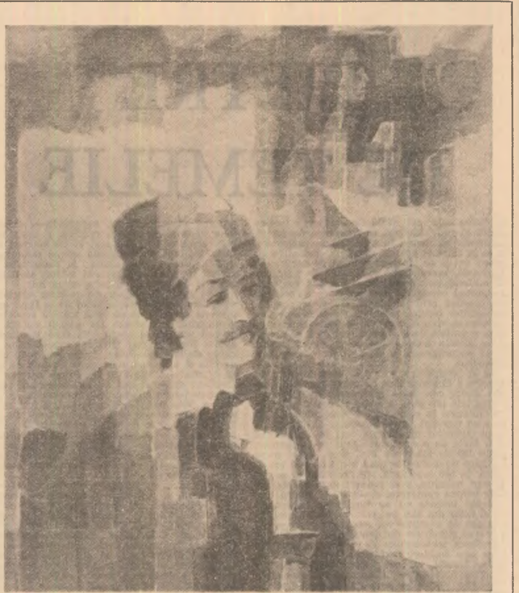
„Avram Iancu” — Tablou de Eftimie Modică