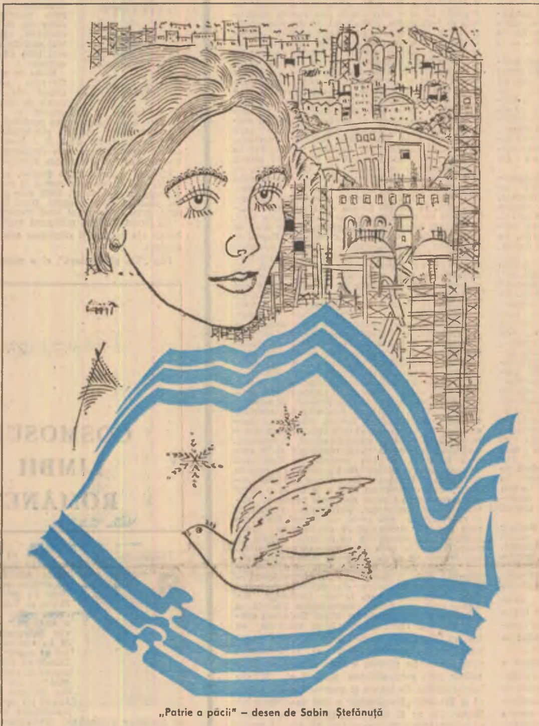
„Patrie a păcii” — desen de Sabin Ștefănuță