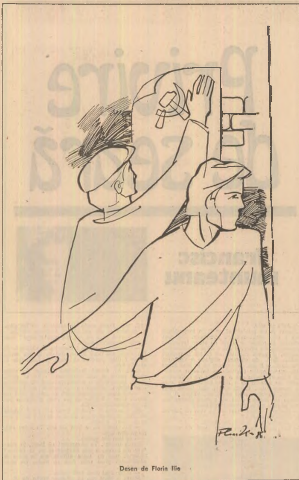
Desen de Florin Iile

„De aceea, preveniții organizați în diferite grupuri, (...) au căutat ca prin conferințe și adunări sub diferite numiri să se strecore neobservați de autorități și propaganda lor comunistă a prins rădăcini, speculînd mai ales pe lucrători și