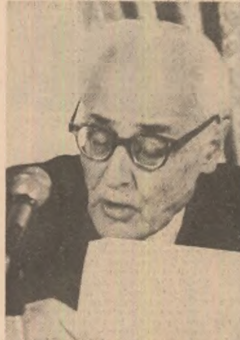
Al. Philippide sau permanența marii poezii