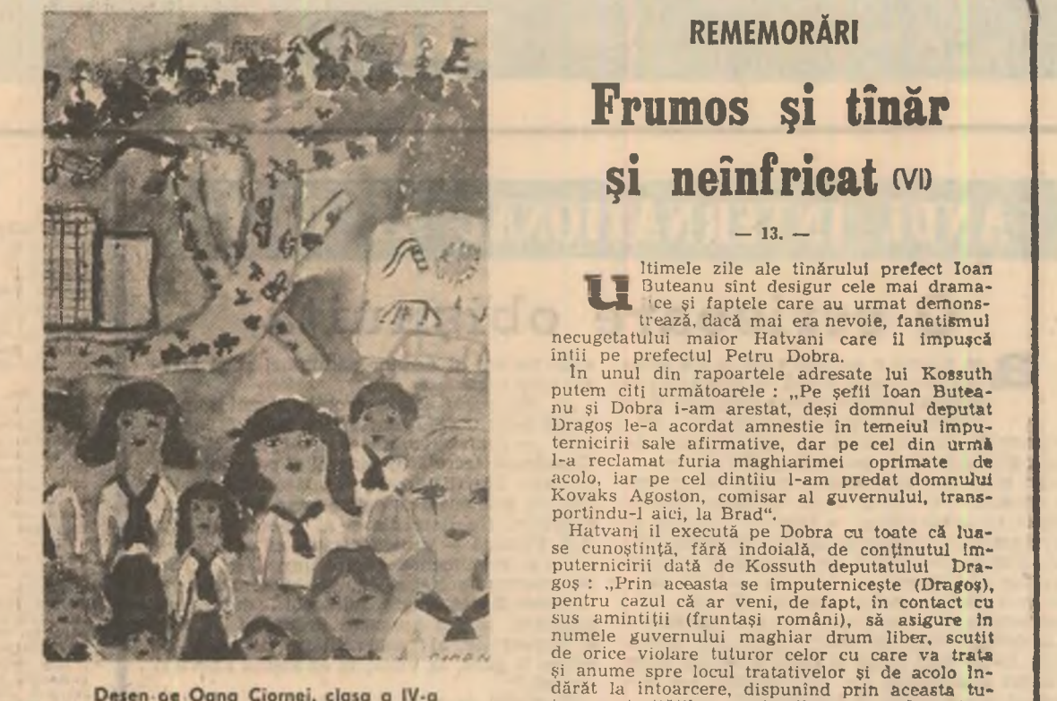
Desen de Oana Ciomei, clasa a IV-a