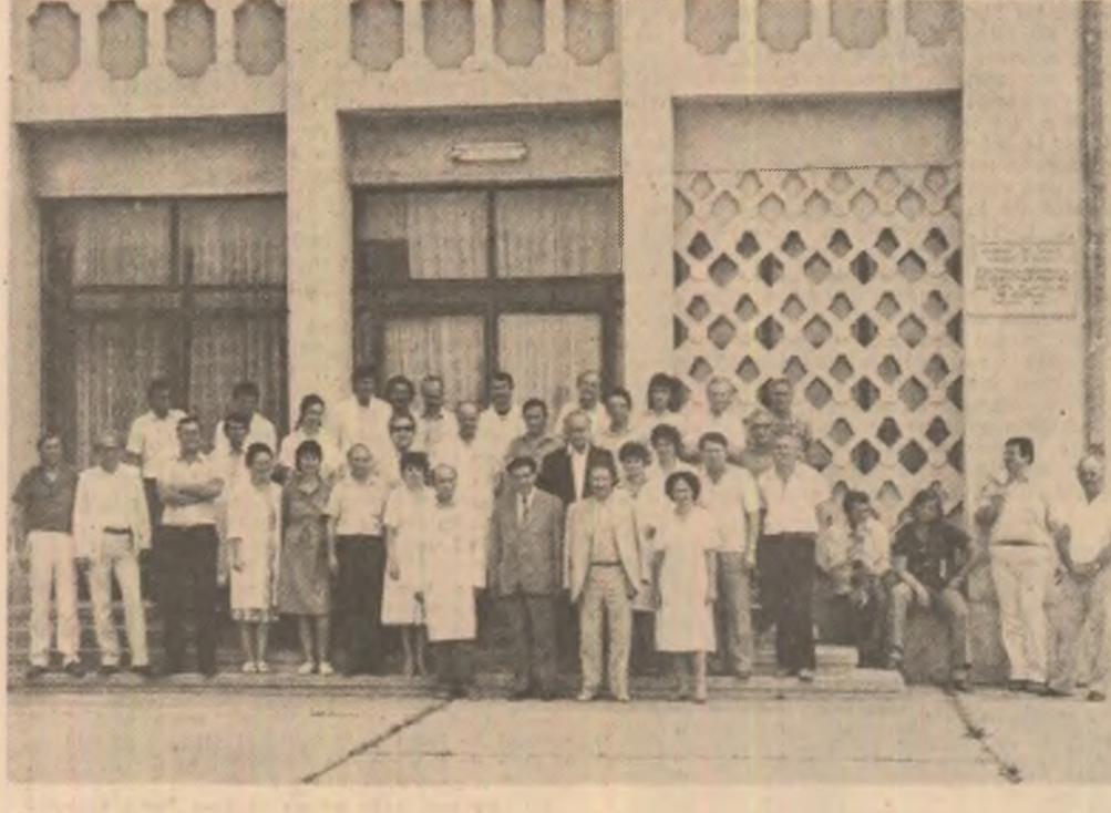
Imagine de la o întâlnire a scriitorilor bucureșteni cu locuitorii ai mealegrilor Doljului