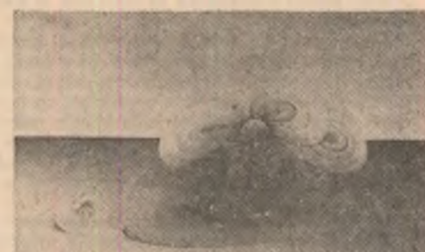
Grafică de Nicolae Sărbu

să ne lăsam pîrul pe spate cum își lasă muntele, amurgul. Cit de tineri sintem ție numai aventura, cînd furtună-i sub noi și deasupra-i furtună. Hai să-l urmărim pe blondul acela înalt ce mă stringea