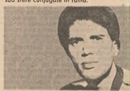
Aprinde-te!... Rogu-te să te aprinzi.

el, despotul palid, eu, uzurpatorul; căci totul este imanență și reflectare, asemănare nesfîrșită, neîndurătoare, visăm în oglindire pantomima morții sub sferă conjugate în ruină.