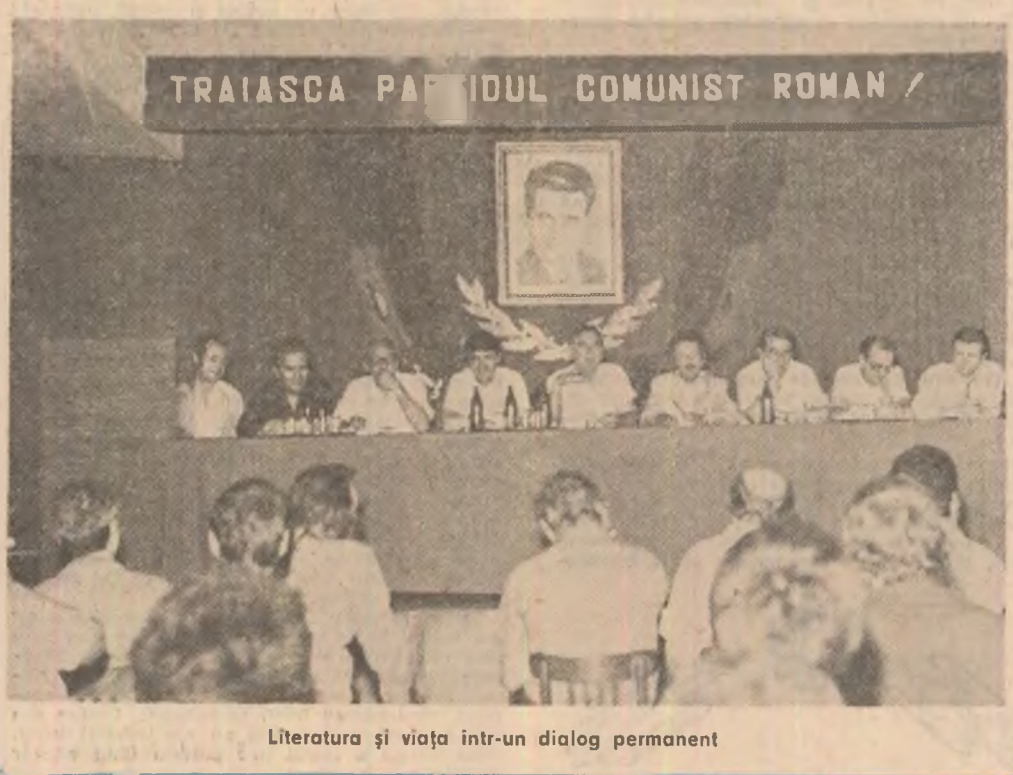
Literatura și viața într-un dialog permanent