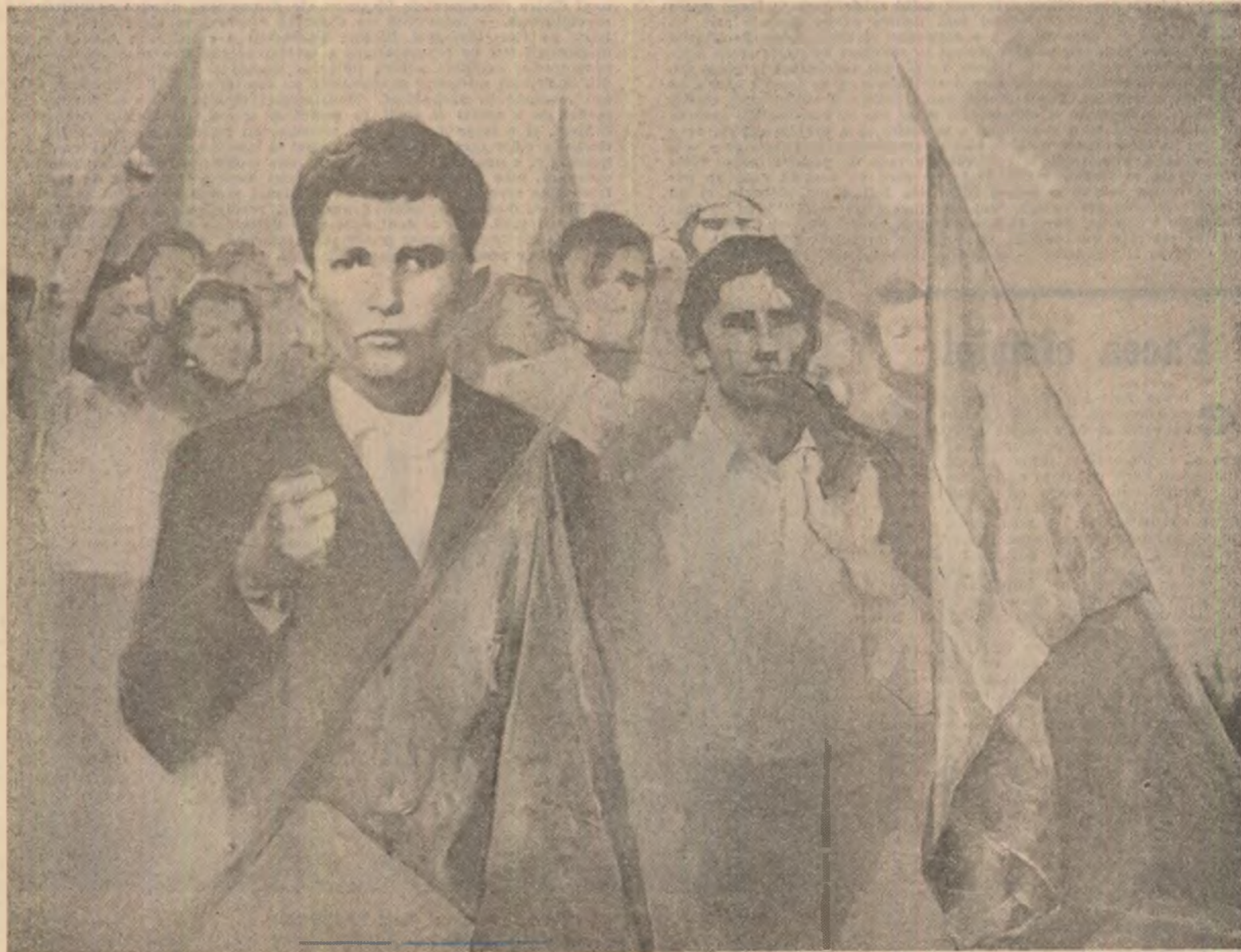
Eugen Palade: „Demonstrație comunistă”

„Vezi, presa a scris mult despre gestul de solidaritate al tovarășului Nicolae Ceaușescu, fapt care ne-a impresionat și pe noi, avocații, și ca instanța să nu uite de el, la fiecare deschidere de sedință ne-am bătu pentru a-l aduce în sala de dezbateri. Dacă nu ar fi fost acel gest nu cred că ar fi avut curajul să fac ceea ce presa a numit „protest violent”, dar știam că tînărul acela „plătise” și pentru noi și consiliul, după eliminarea lui, nu și-ar fi putut permite să mă