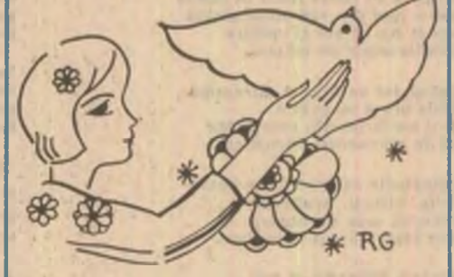
Desen de Raluca Grigorec