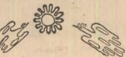
Desen de Nicolae Gadonschi

— Uite-le! — Ea s-a întors spre portită. „Si-a dat seama”, se gîndea el. Si, cum nu vedea nimic, a luat-o încet înainte, spre capătul străzii, să găsească măcar un băț cu care să simtă din nou, în palmă, oamenii, mașinile, drumul.