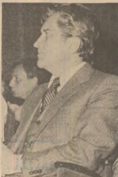
Acad. Al. Balaci, „la aniversară”