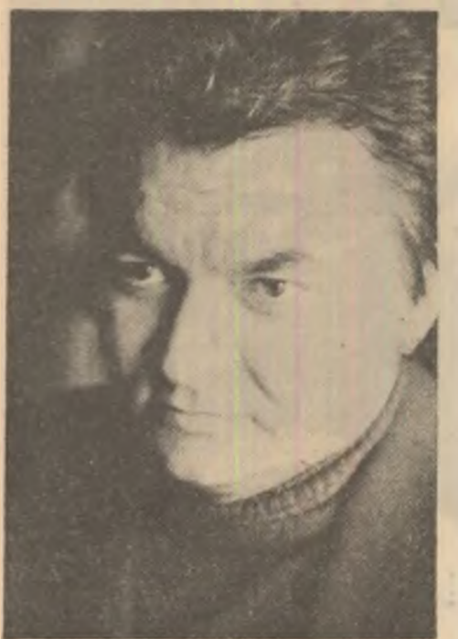
Un nume impus în sociologia culturii: Ilie Bădescu