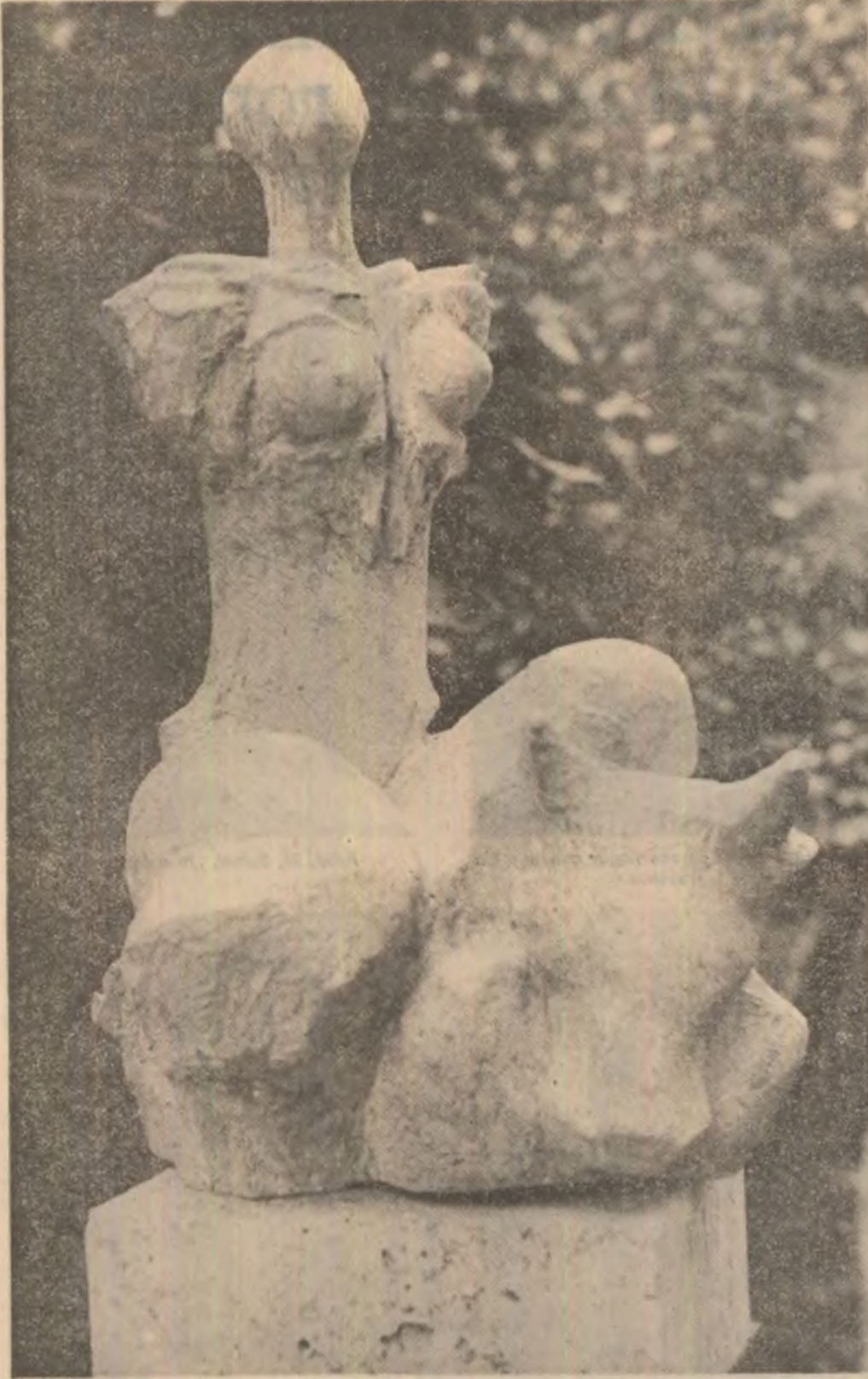
Valentina Boștină : „Răpirea Europei”

Să nu te sperii cînd își va izbi cometa în ferestrele coada de pește. Presupune că sîntem.