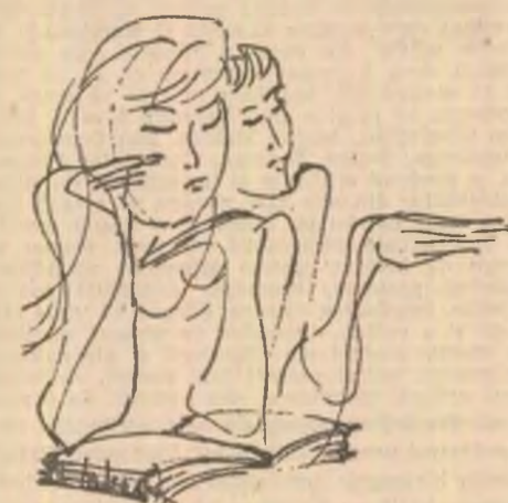
Ilustrația la volumul M. Eminescu : „Poezii” de Mihai Takacs

Doi ochi de copil, norocoși, adînci ca niște ere... Mii de muguri explodează. Nu se aude decît murmurul primăverii.