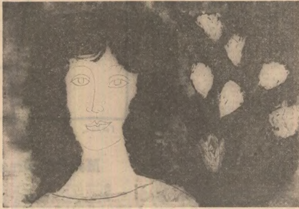
Tablouri de Dragoș Morărescu

Am luat-o pe străzi cu gîndul să ajung acasă, dar casa mea era departe. Totuși mă simțeam mai bine. O senzație eliberatoare, de încredere, purse stăpînire pe mine. Nu-mi era teamă. Mergeam pe străzi ca un om mare și nimeni nu se mira. Apoi descopeream noul, neprevăzutul,