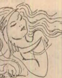
Desen de Mihai Tokocs