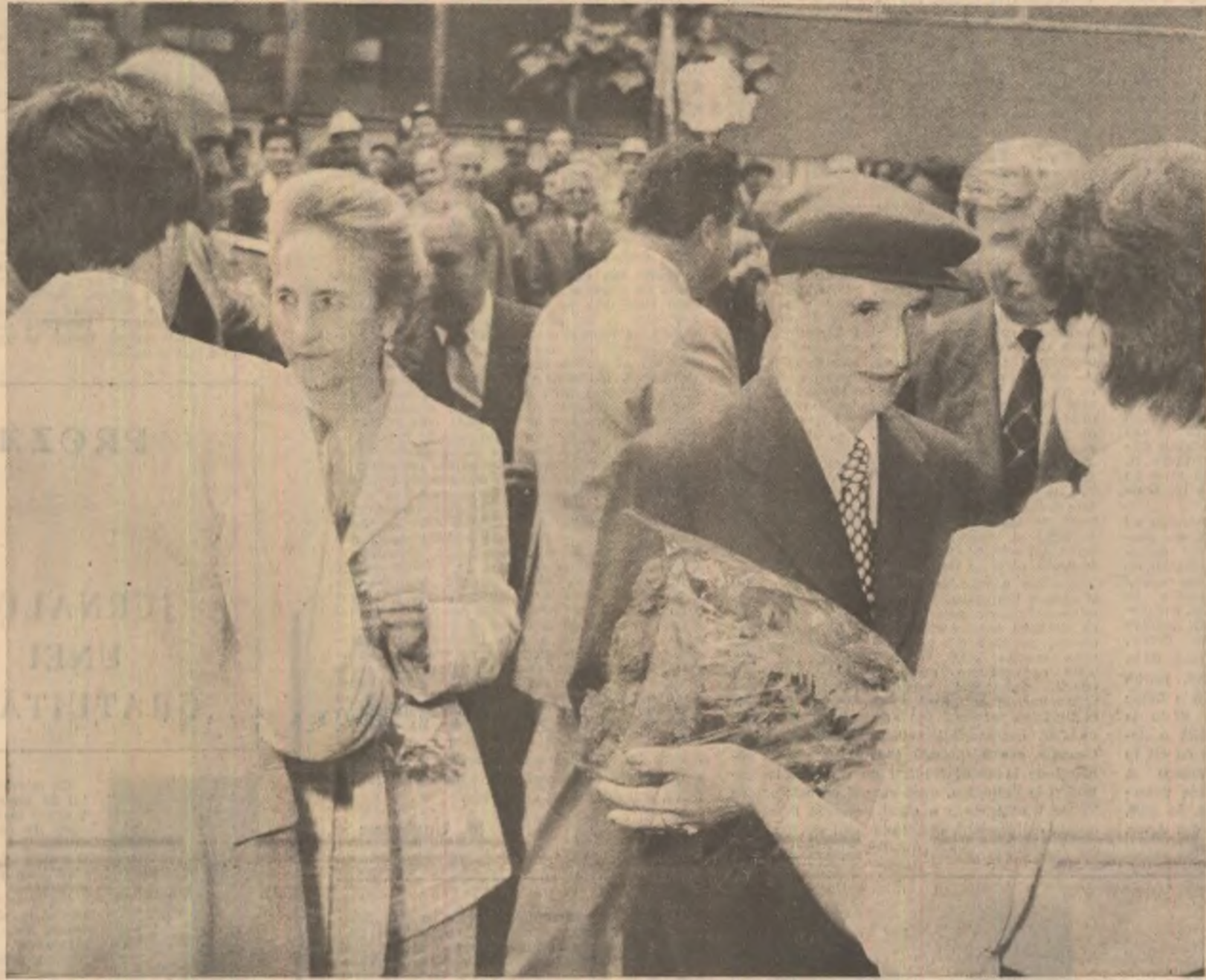
Imagine din timpul vizitei de lucru efectuată de tovarășul Nicolae Ceaușescu, împreună cu tovarășa Elena Ceaușescu, în județul Brașov

Ceea ce îl este proprie creație este locușorul și acest sentiment al participării. Fenomen real, tînd de condiția propriei noastre existente și în același timp de condiția spiritualității epocii noastre. Festivalul Național Cîntarea României se poate defini în acest fel și ca un mod, ca o platformă de atitudine, ca o expresie a angajării și responsabilității. Altfel spus, creația este o problemă de creație, în general, și în același timp un mod de a răspunde individual, ca manifestare a vocației, a spiritului creator. Cîntarea României este o problemă de creație, în general, și în același timp un mod de a răspunde individual, ca manifestare a vocației, a spiritului creator. Cîntarea României este o problemă de creație, în general, și în același timp un mod de a răspunde individual, ca manifestare a vocației, a spiritului creator.